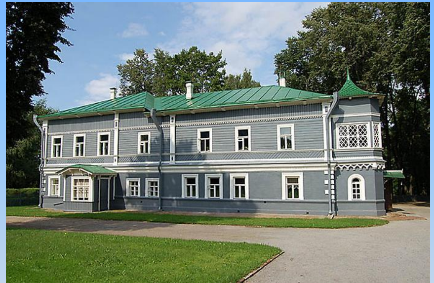
Ныне Дом-музей им. Чайковского