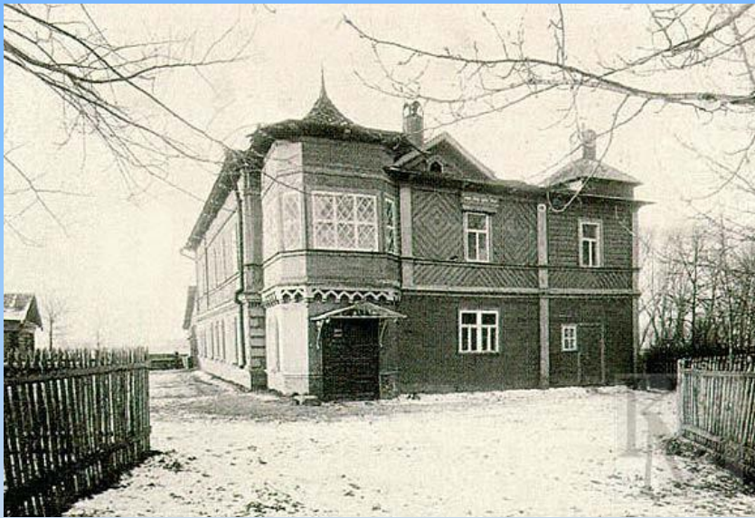
Дом П. И. Чайковского в Клину. 1893 год.

В 1892 году обосновался в Клину, под Москвой