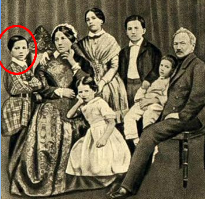
Семья Чайковских в 1848 году (крайний слева — Пётр Ильич)

Родился 25 апреля 1840 года в селении при Камско - Воткинском заводе Вятской губернии (ныне город Воткинск, Удмуртия). Пётр был вторым ребёнком в семье.