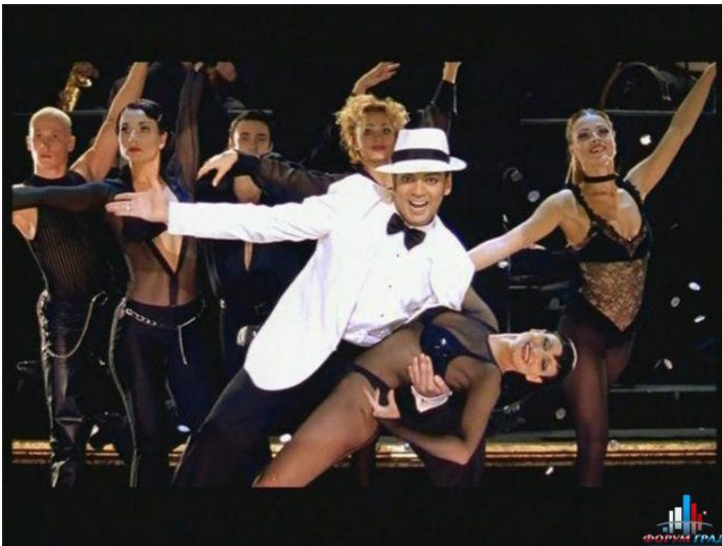
Мюзикл Чикаго - Тюремное танго (русская версия) .