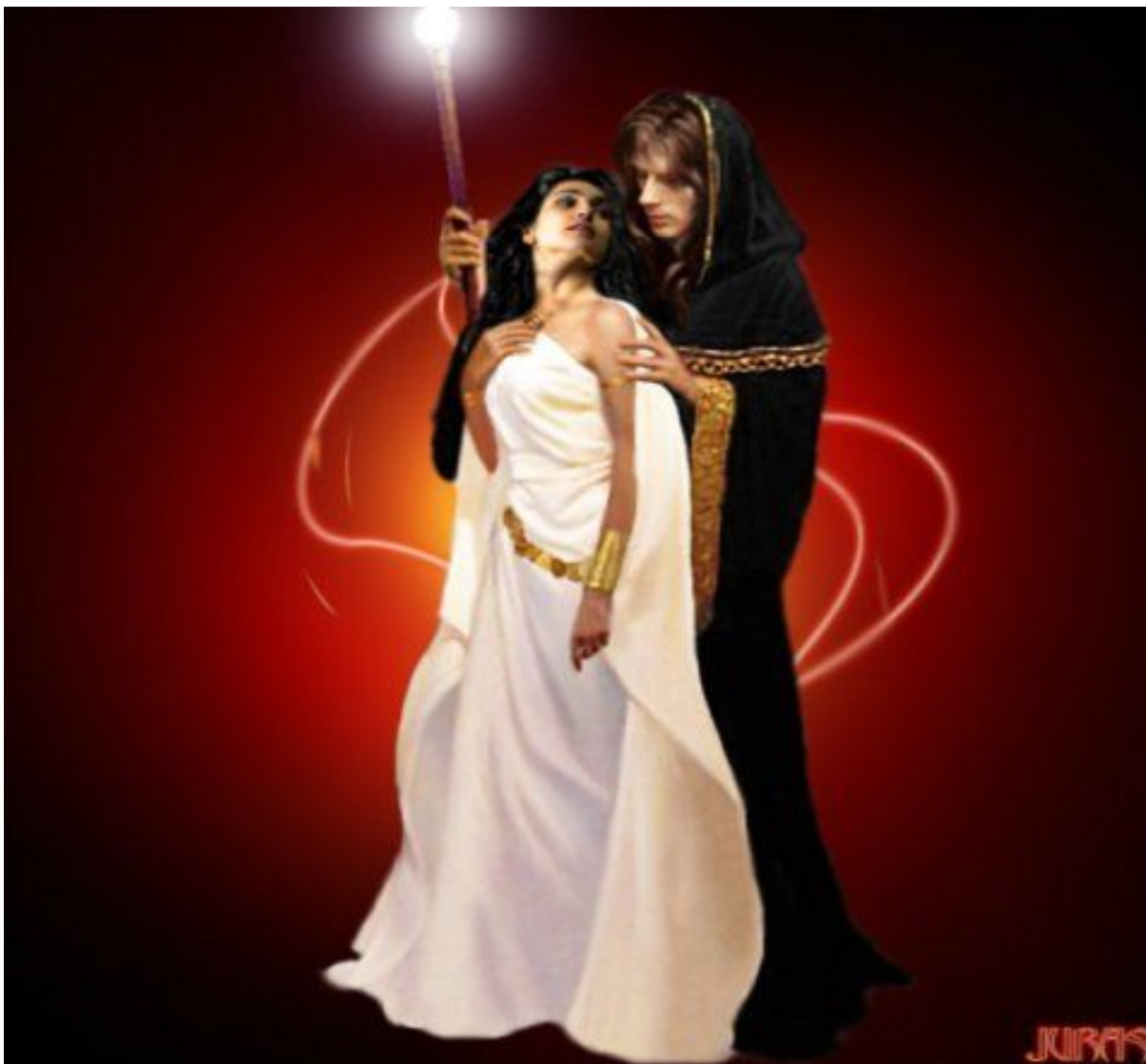
Фэнтэзи Мюзикл "Последнее Испытание"