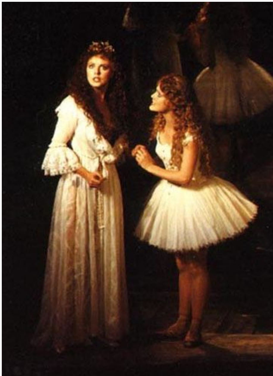
Мюзикл "Призрак Оперы"