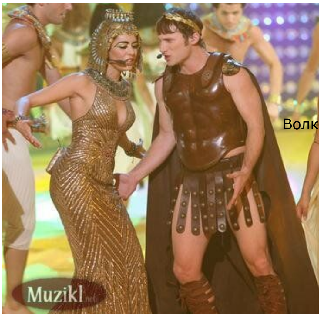
Волк и семеро козлят, МЮЗИКЛ