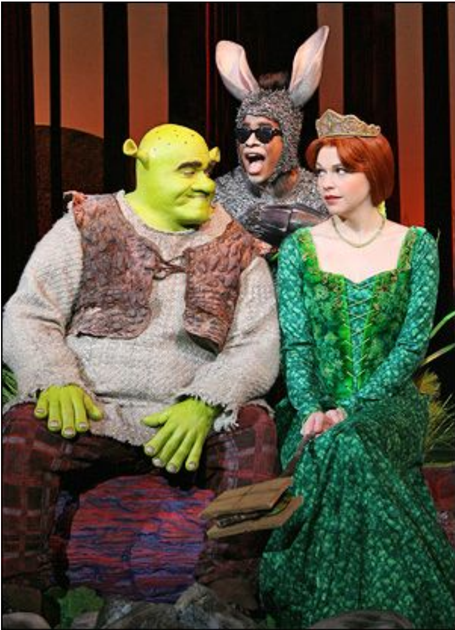
Shrek The Musical Broadway Theatre New York.