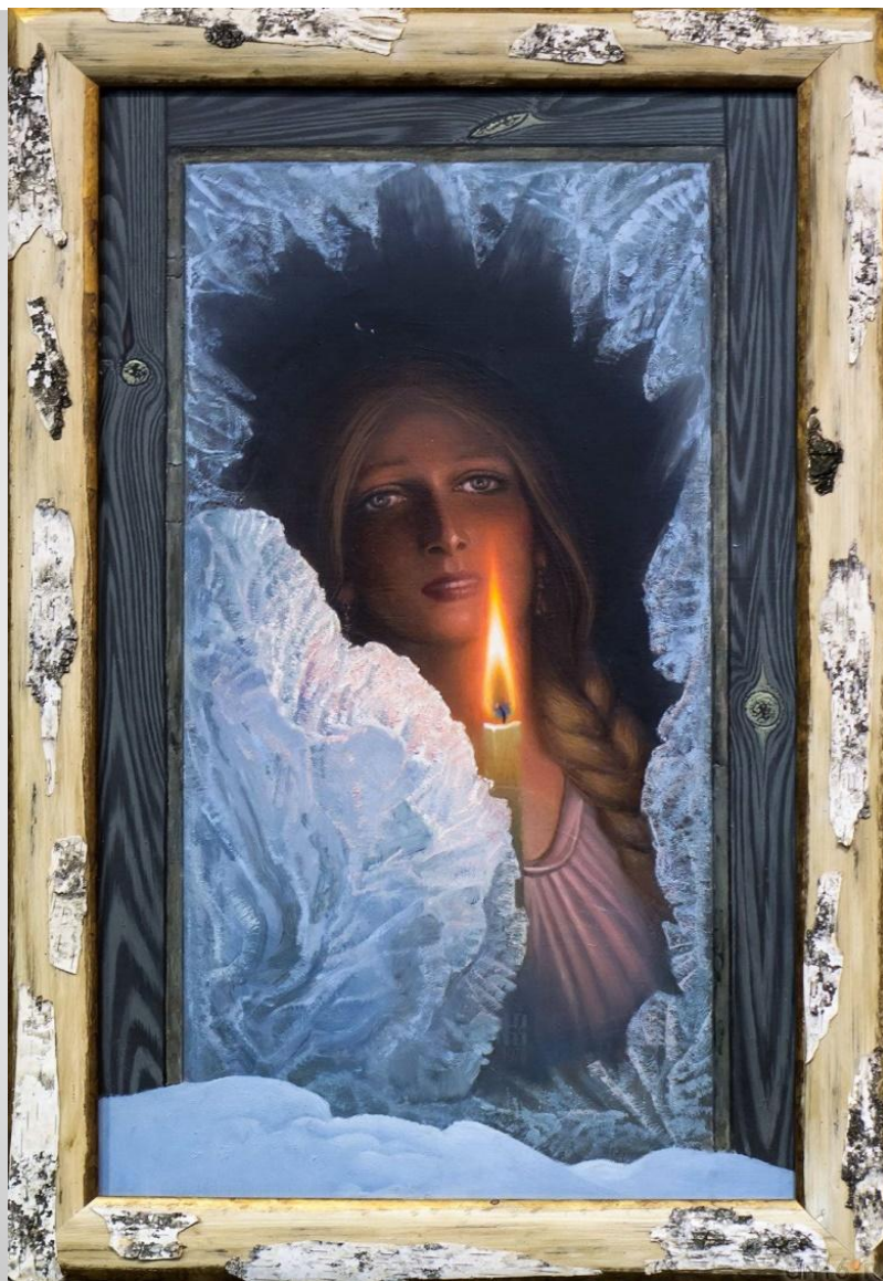
К. Васильев «Ожидание»