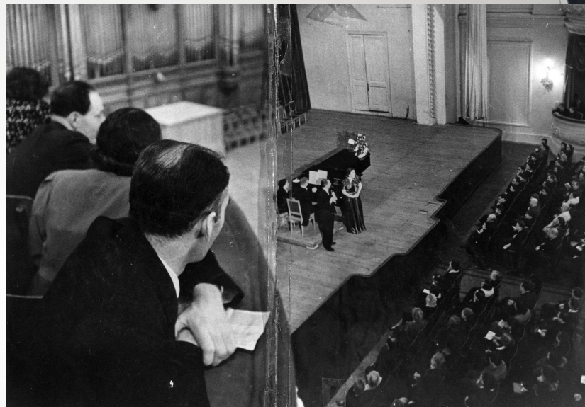
Большой Зал Консерватории