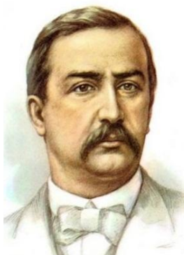
А. Бородин- композитор