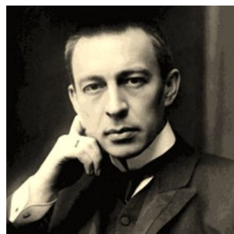
С. Рахманинов – композитор