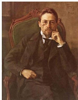
А. П. Чехов -писатель