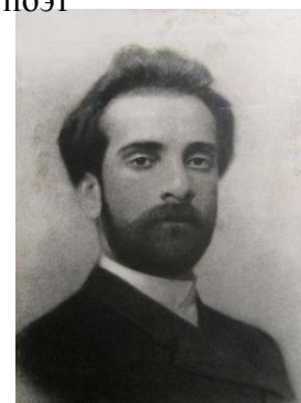
Исаак Левитан – художник