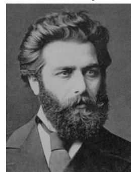
А. Куинджи – художник