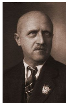
Б. В. Асафьев – композитор