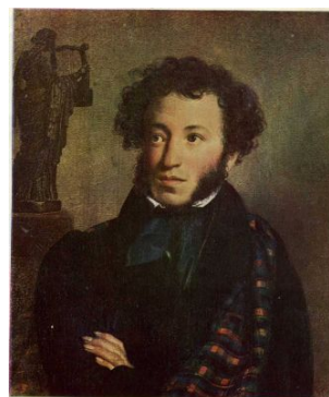
А. Пушкин – писатель, поэт