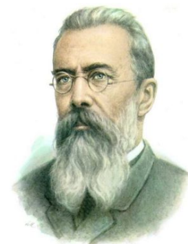
Н. А. Римский –Корсаков - композитор