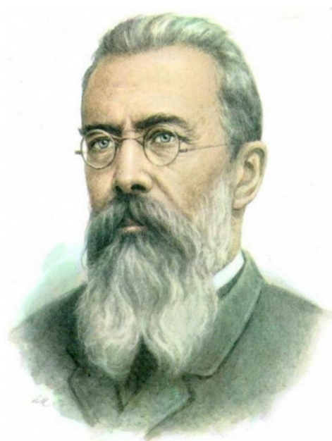
Н.А.Римский – Корсаков

Редает облаков летучая гряда. Звезда печальная, вечерняя звезда! Твой луч осеребрил увядшие равнины, И дремлющий залив, и черных скал вершины. Люблю твой слабый свет в небесной вышине; Он думы разбудил, уснувшие во мне: Я помню твой восход, знакомое светило, Над мирною страной, где все для сердца мило, Где стройны тополы в долинах вознеслись, Где дремлет нежный мирт и темный кипарис, И сладостно шумят полуденные волны. Там некогда в горах, сердечной думы полный, Над морем я влачил задумчивую лень, Когда на хижины сходила ночи тень – И дева юная во мгле тебя искала И именем своим подругам называла.