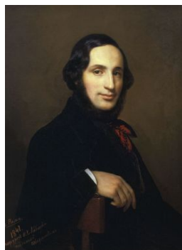
А. Айвазовский- художник