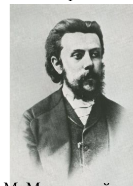
М. Мусоргский – композитор