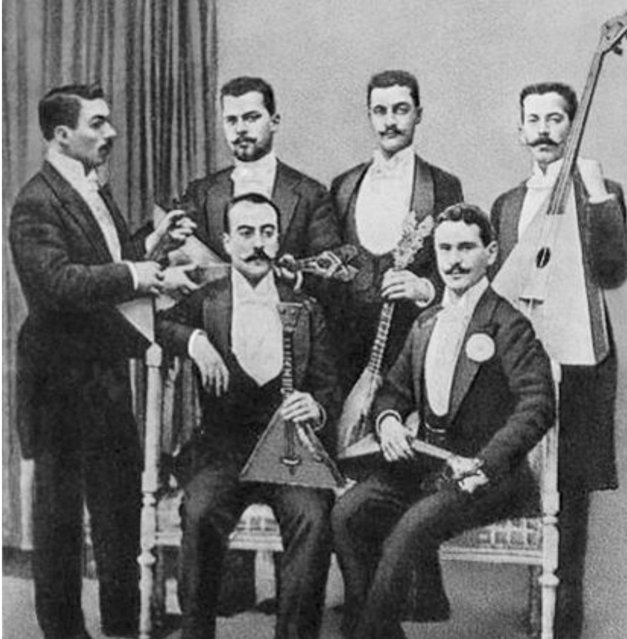
Кружок любителей игры на балалайках.