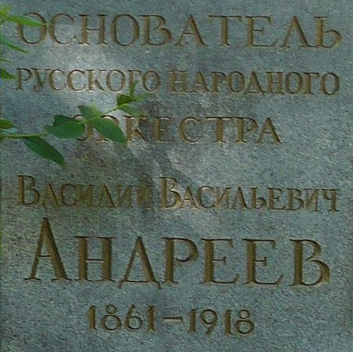
Могила В.В.Андреева в Алекса́ндро – Невско́й лавре