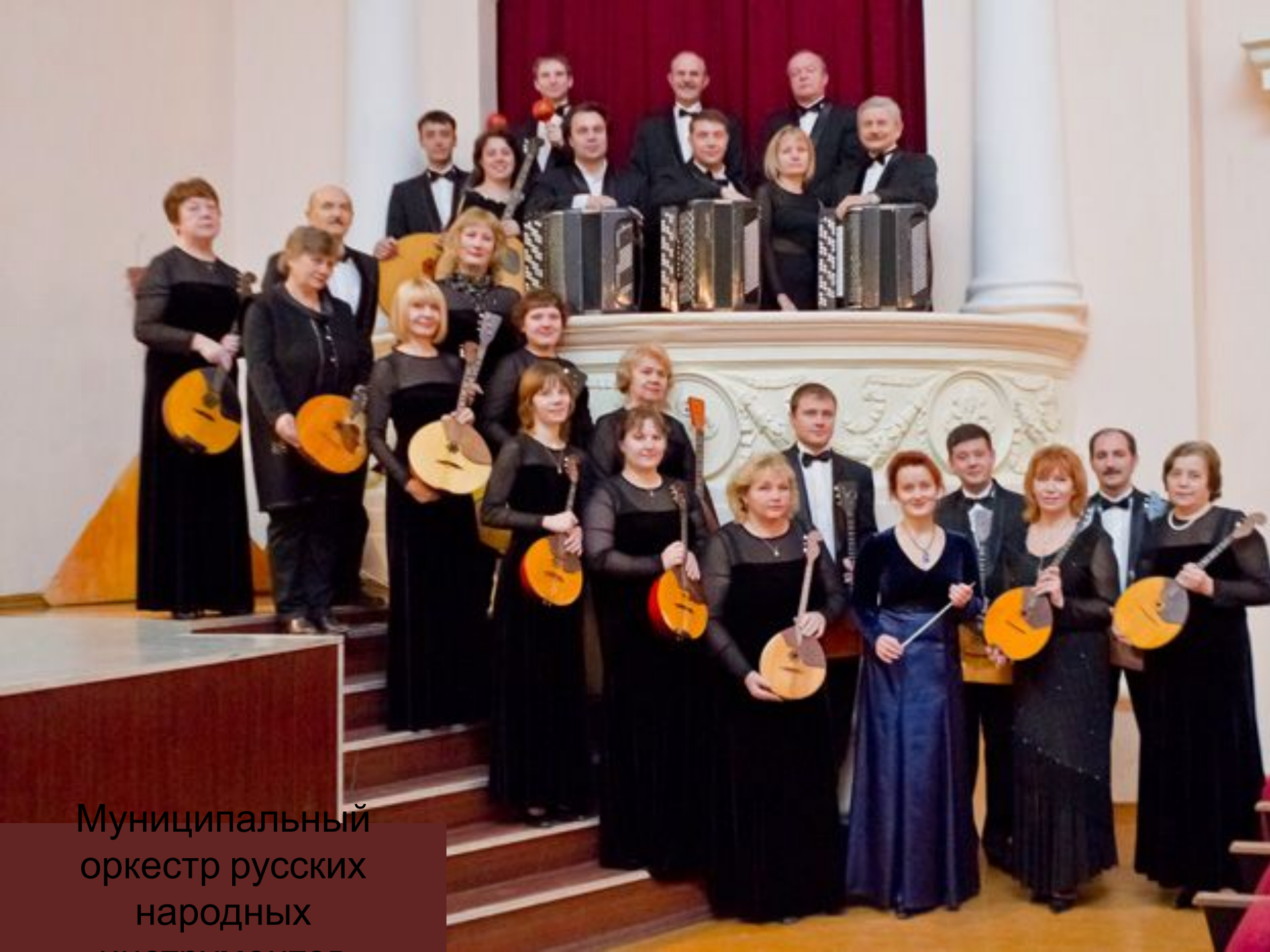
Муниципальный оркестр русских народных инструментов