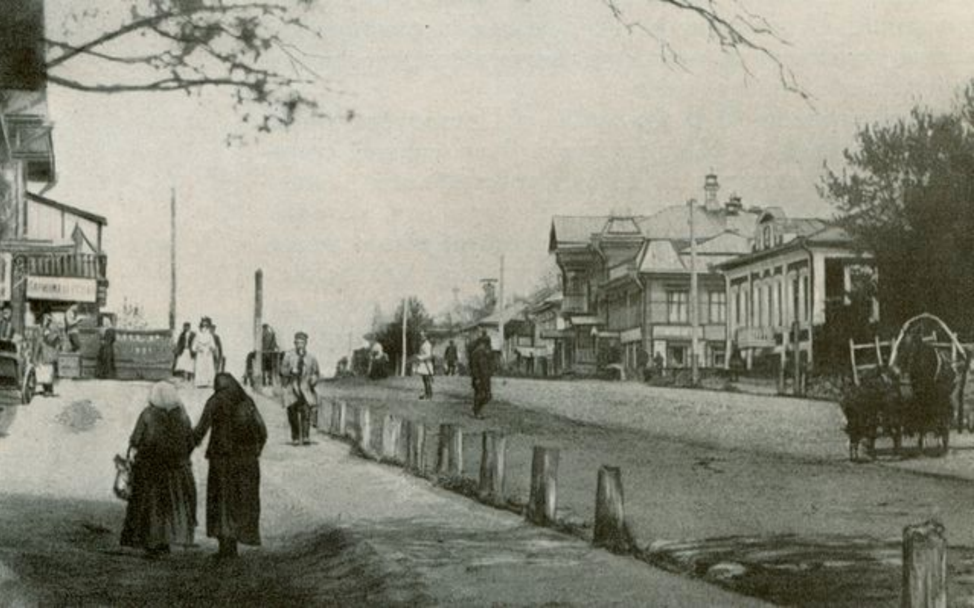
Город Бежецк в конце XIX века