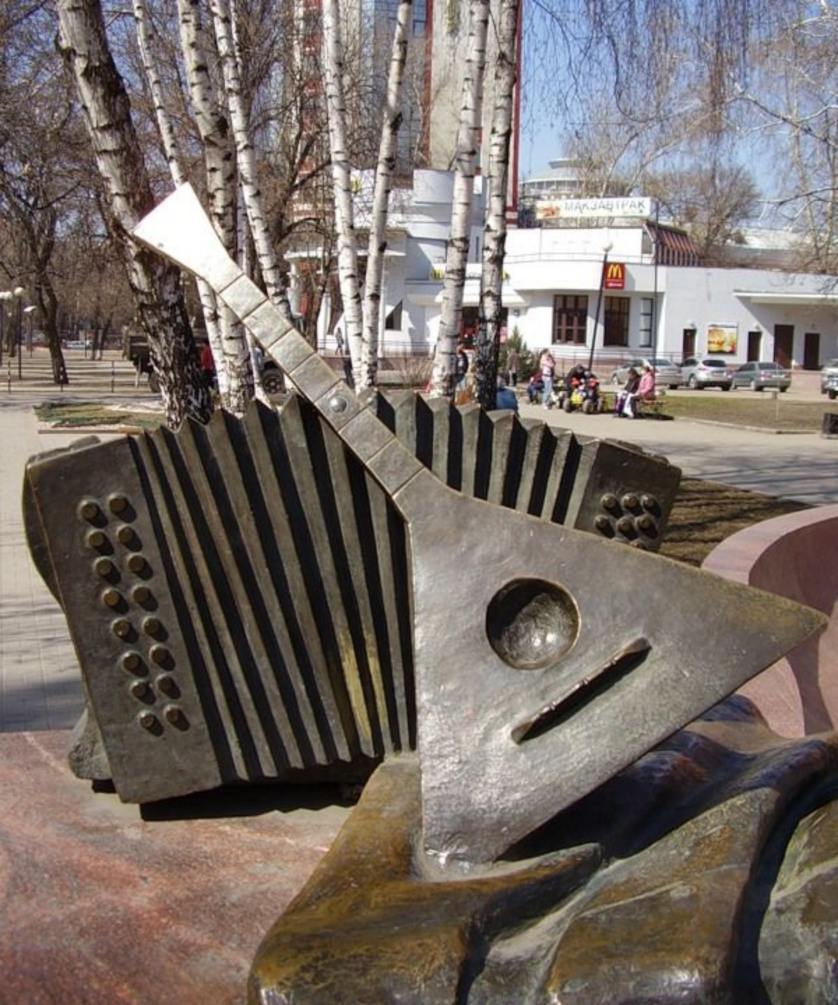
Памятник балалайке и гармошке в Воронеже