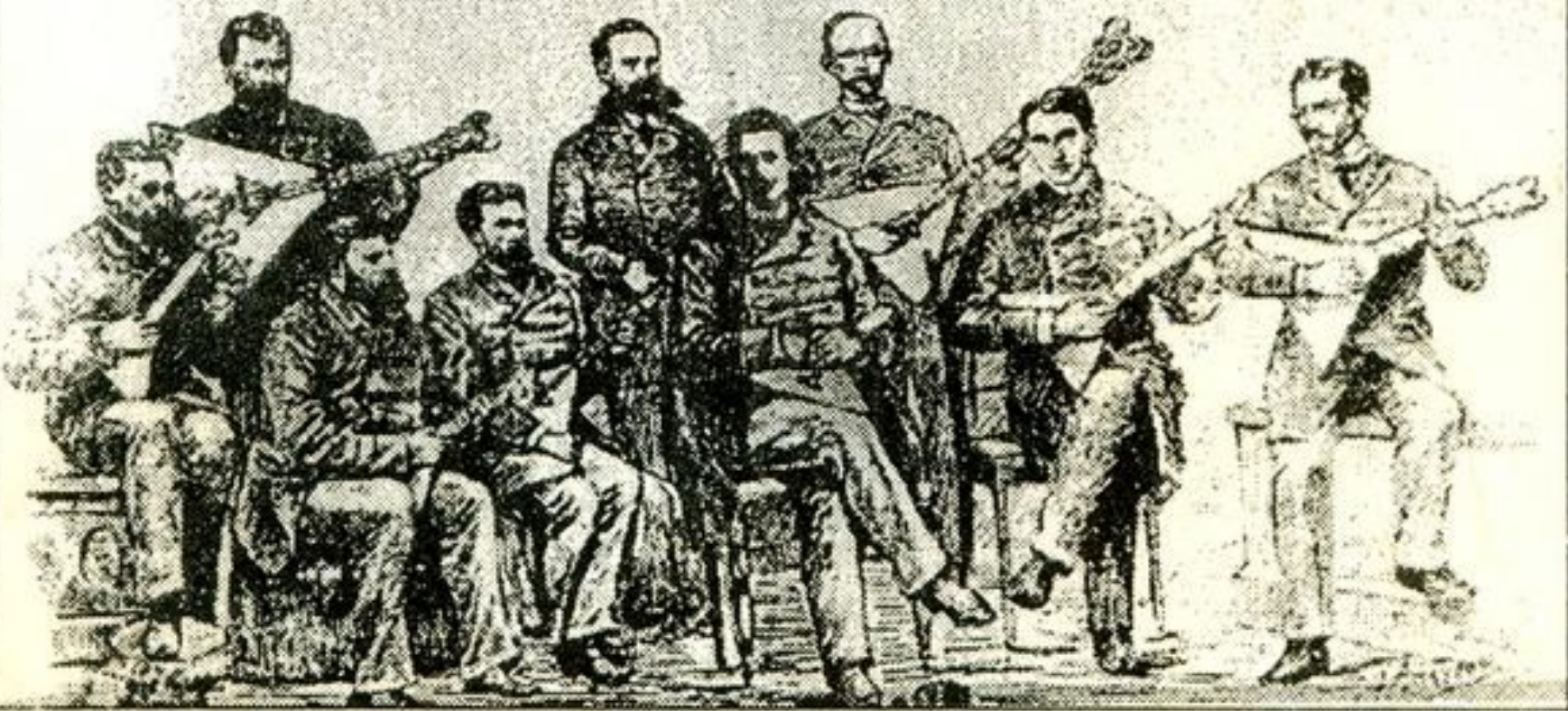
Кружок балалаечников под управлением В. В. Андреева. 1888 г.