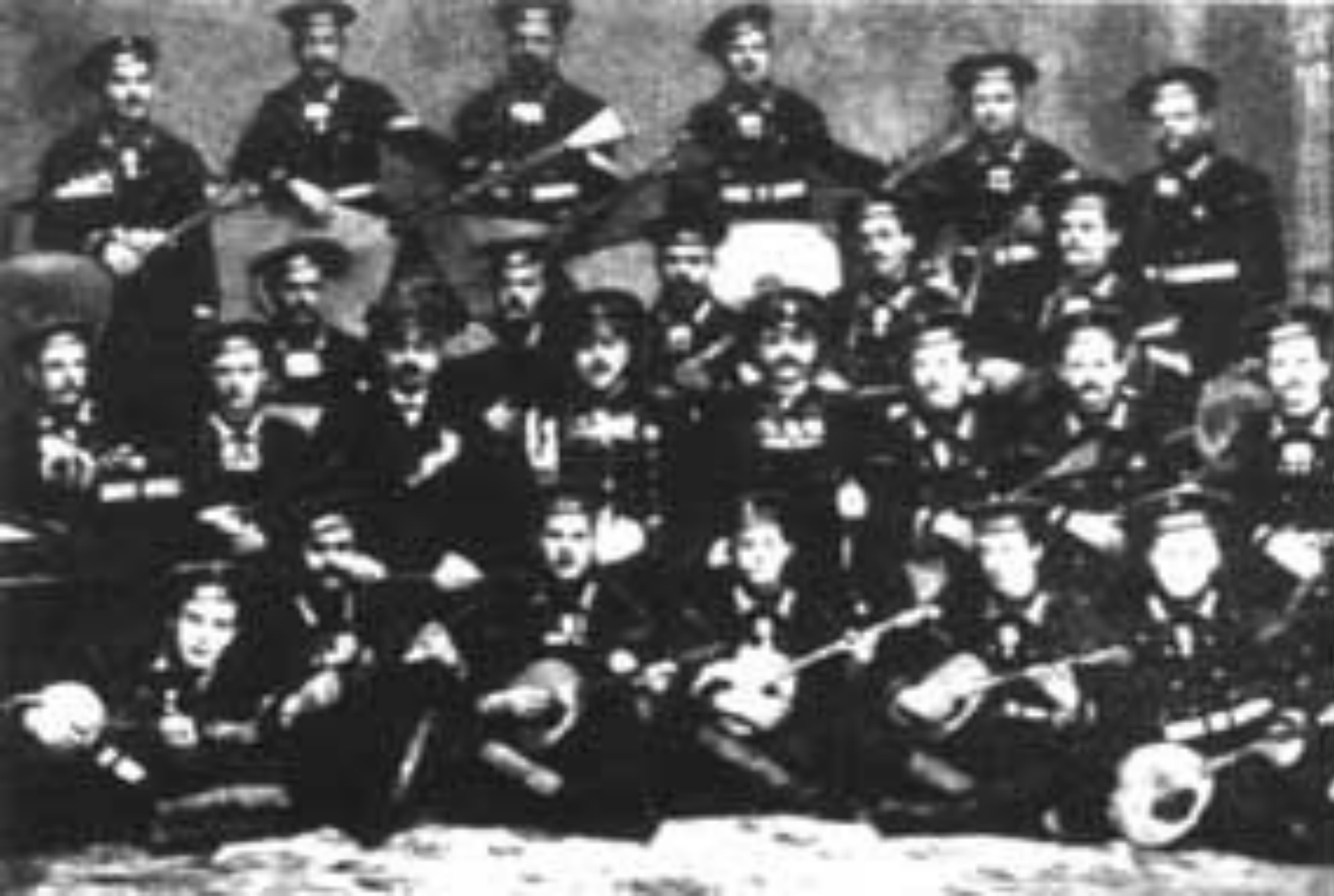
Великорусский ансамбль Гвардейского экипажа