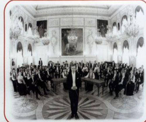
Directeur artistique et chef d'orchestre