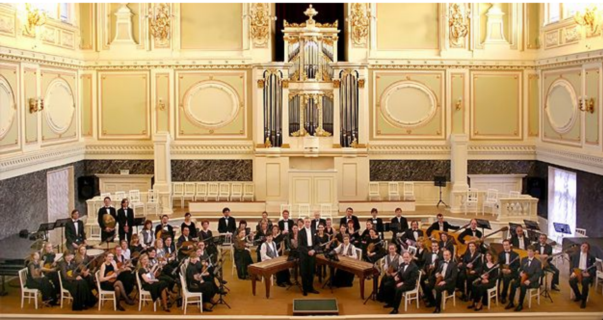
Государственный академический русский оркестр имени Андреева