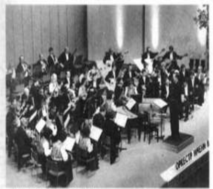
民族楽器を駆使し、民衆の魂、を込め、最高峰に昇華した国立ロシア民族オーケストラ（東京・品川試演）

民衆の魂の調べに喝采 創立者の名譽会長にバラライカを贈呈 民謡や日ソの市民結ぶ友情の舞台