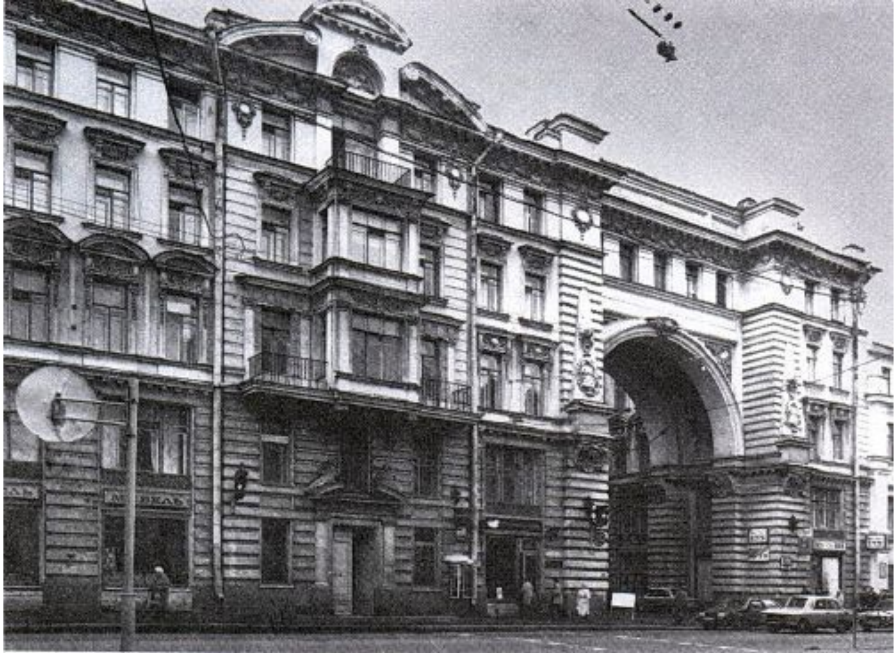
Дом в Санкт – Петербурге, где жил В.В.Андреев