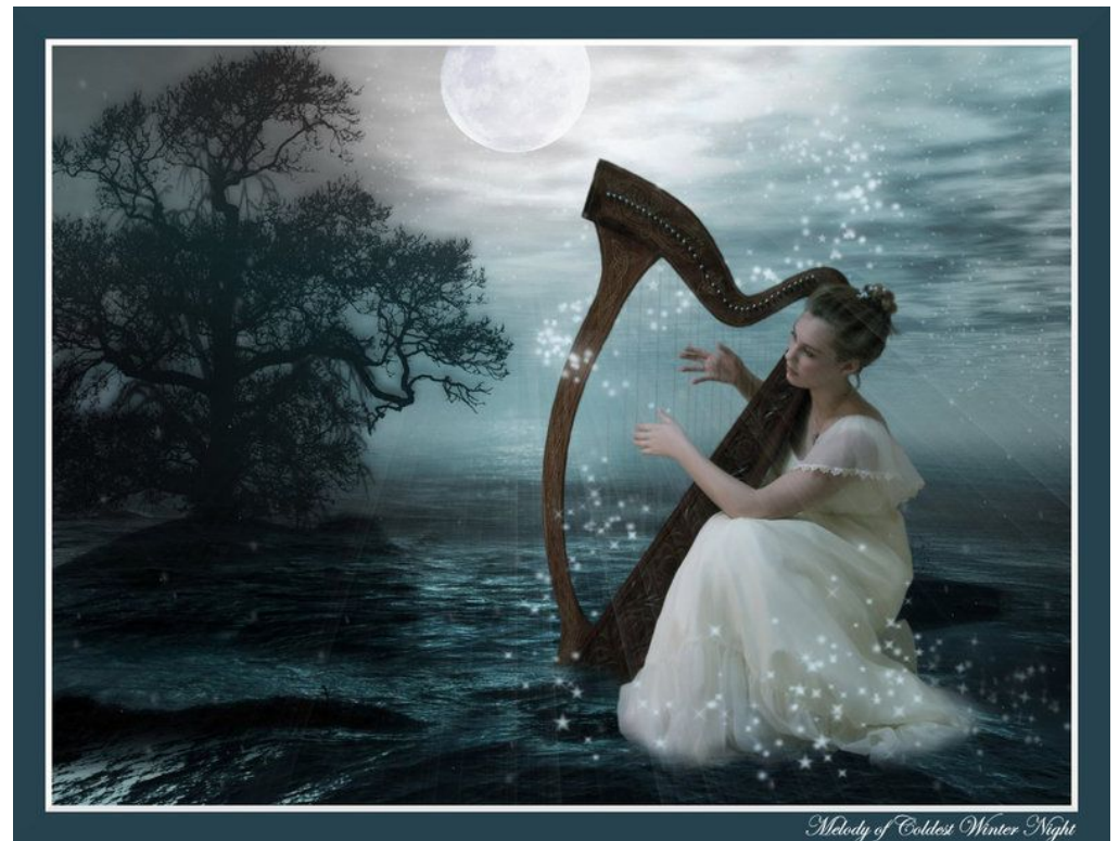
Melody of Coldest Winter Night

Музыка – это трансформация космической энергии через сознание человека. Это искусство, пожалуй, самое великое и прекрасное искусство в истории человечества! Ничто не может ярче выразить ЭГО и сущность человека, как музыка!