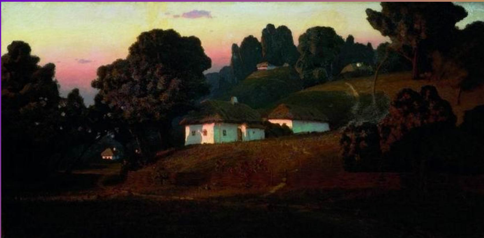
Куинджи «Вечер на Украине»