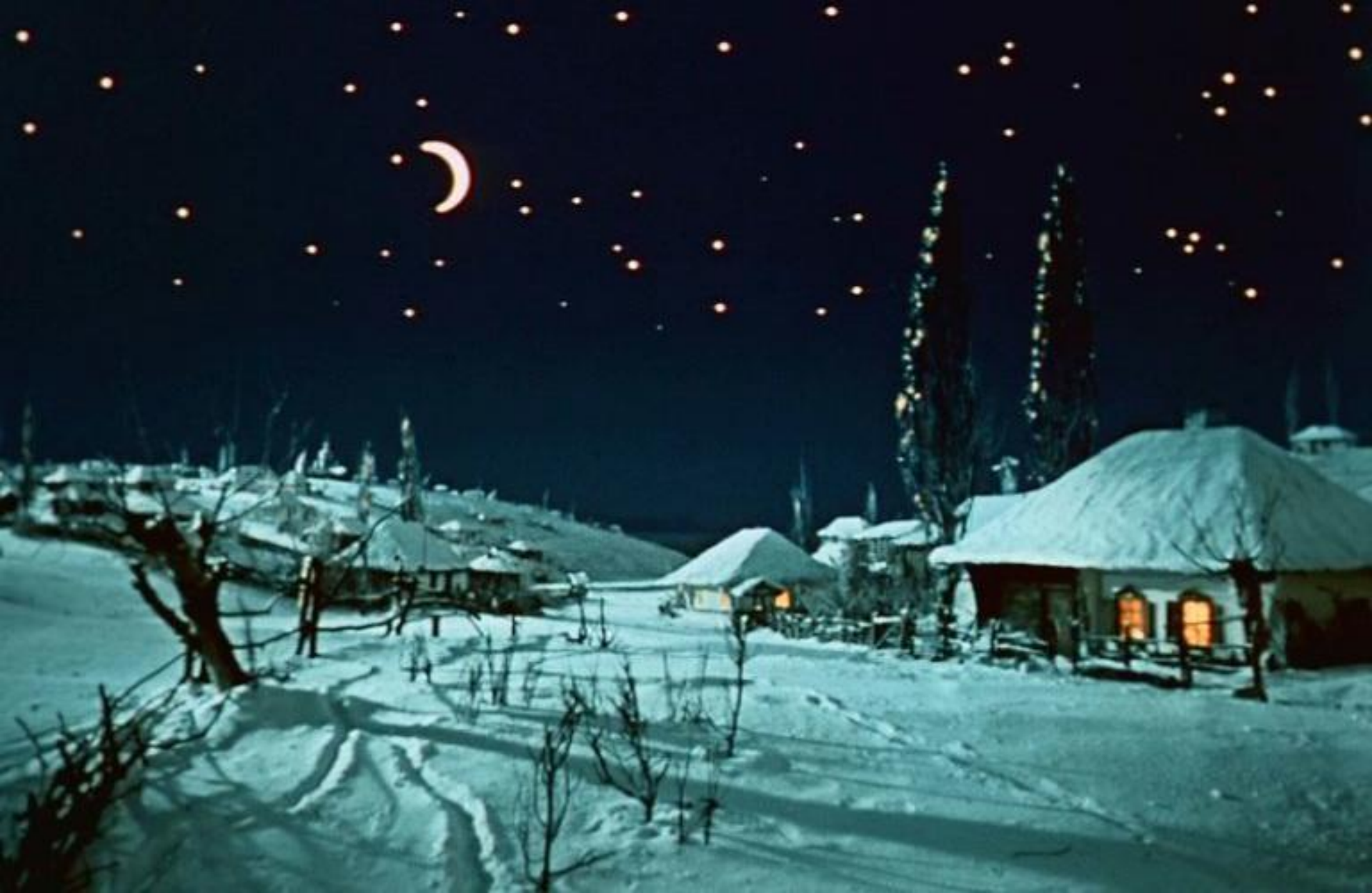
Н. В. Гоголь «Вечера на хуторе близ Диканьки»