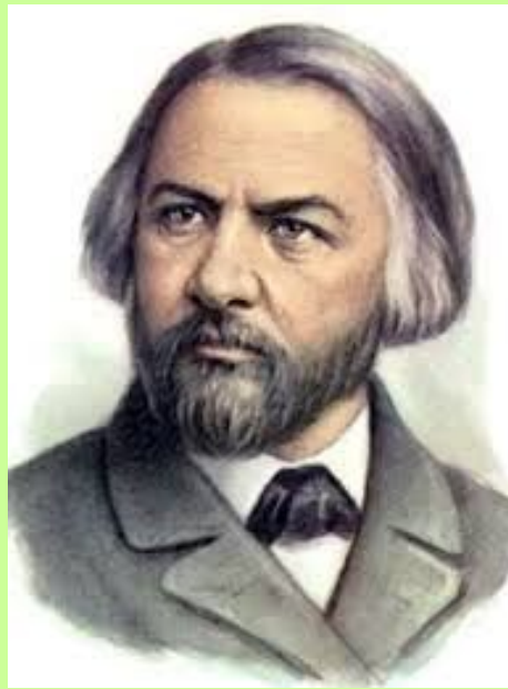
М.И. Глинка «Прощание с Петербургом» сл. Н. Кукольника