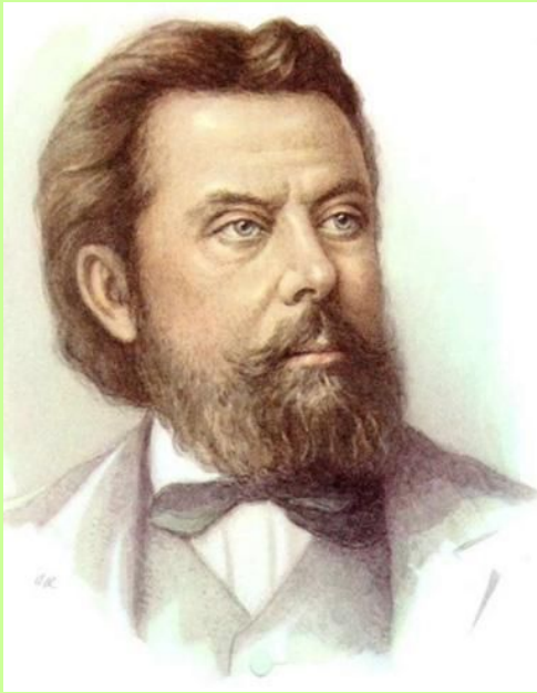
М.П. Мусоргский «Детская» сл. М. Мусоргского