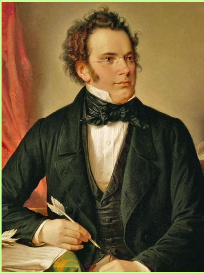
Франц Петер Шуберт (1797-1828) Австрия