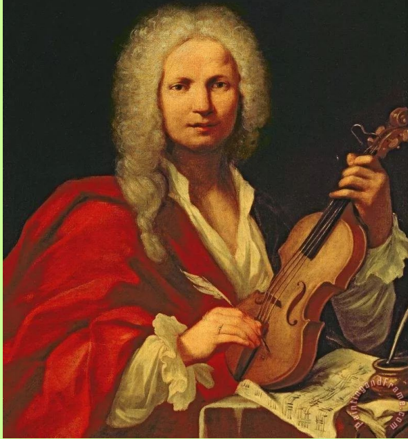
А. Вивальди «Времена года»