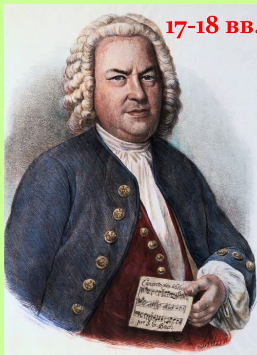
И. С. Бах «Прелюдия и фуга» «Хорошо темперированный клавир»