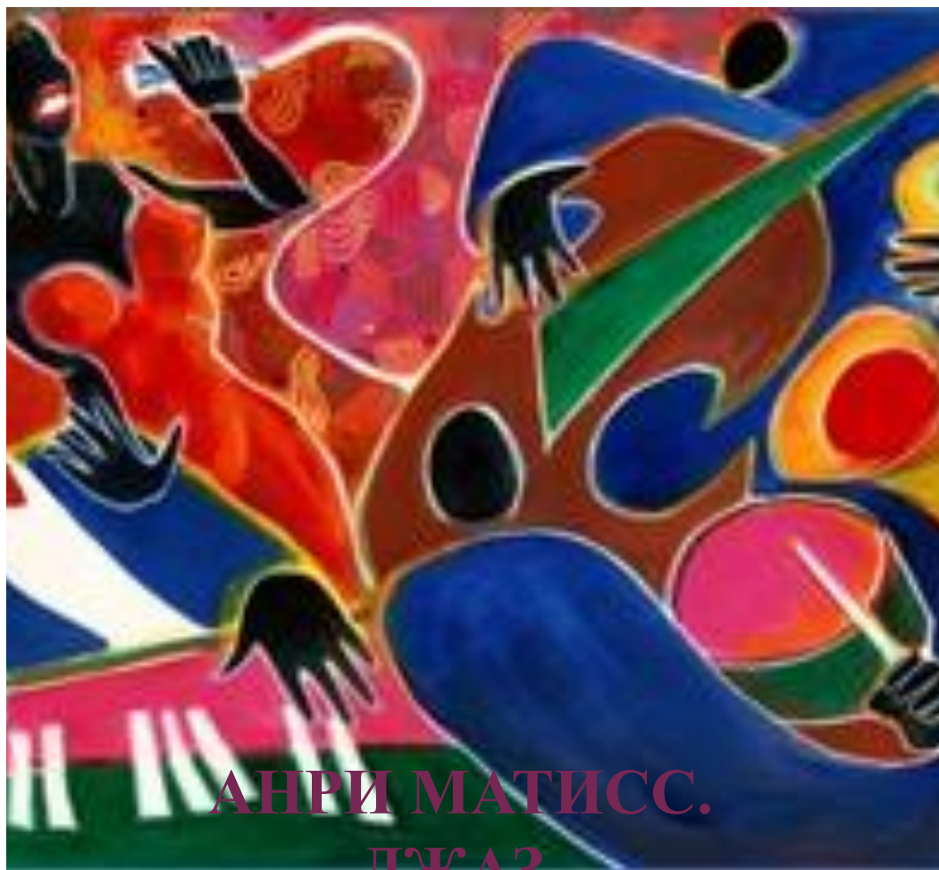
АНРИ МАТИСС. ДЖАЗ.