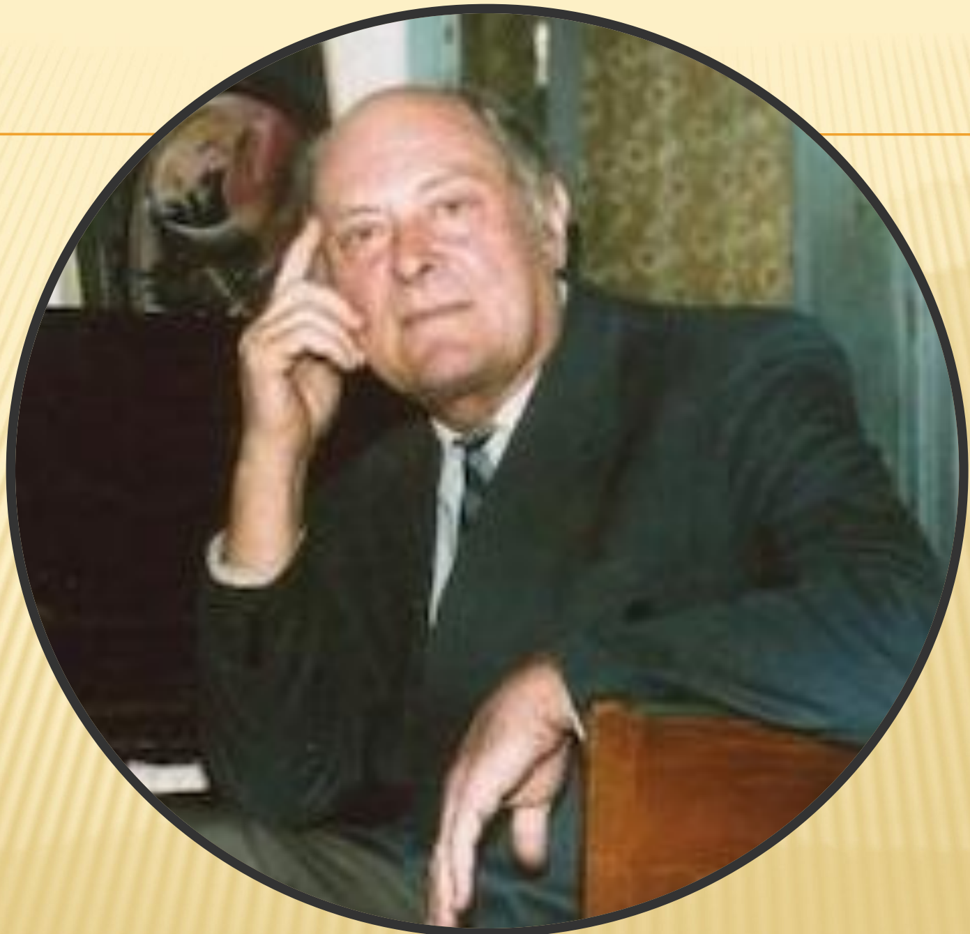
Алемдар Сабитович Караманов автор Гимна Крыма