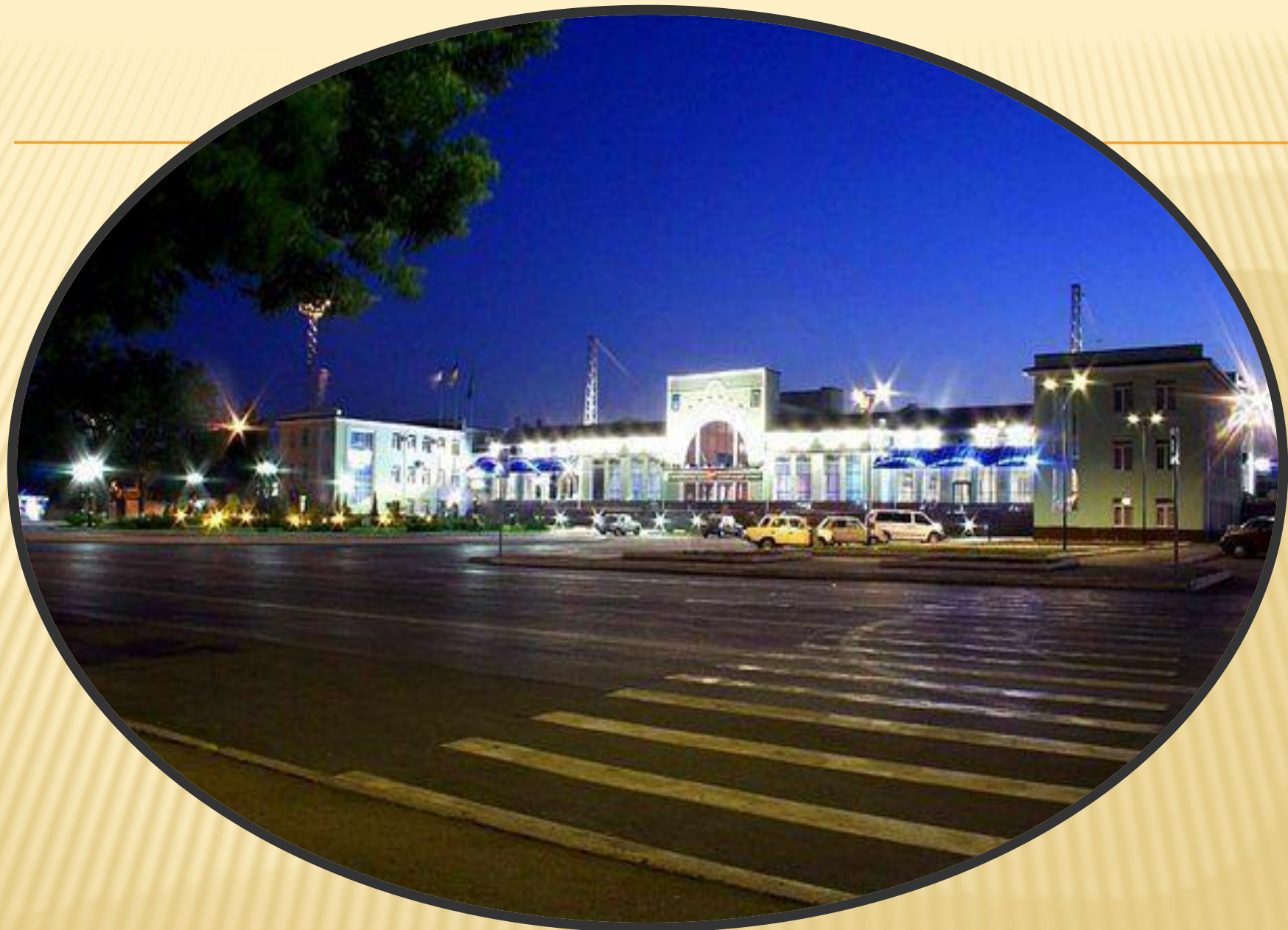
Привокзальная площадь г. Джанкой