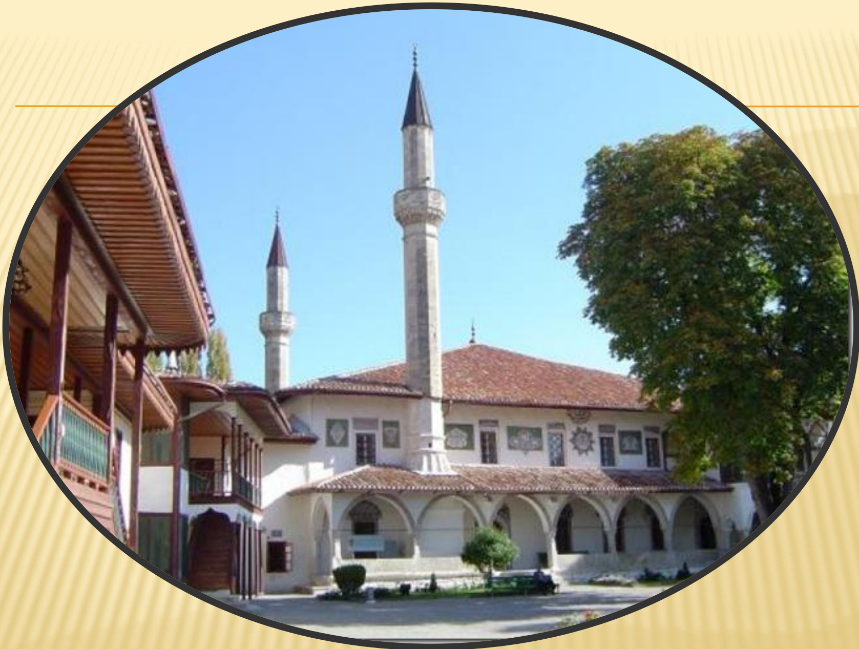
Дворец хана Гирея – г. Бахчисарай