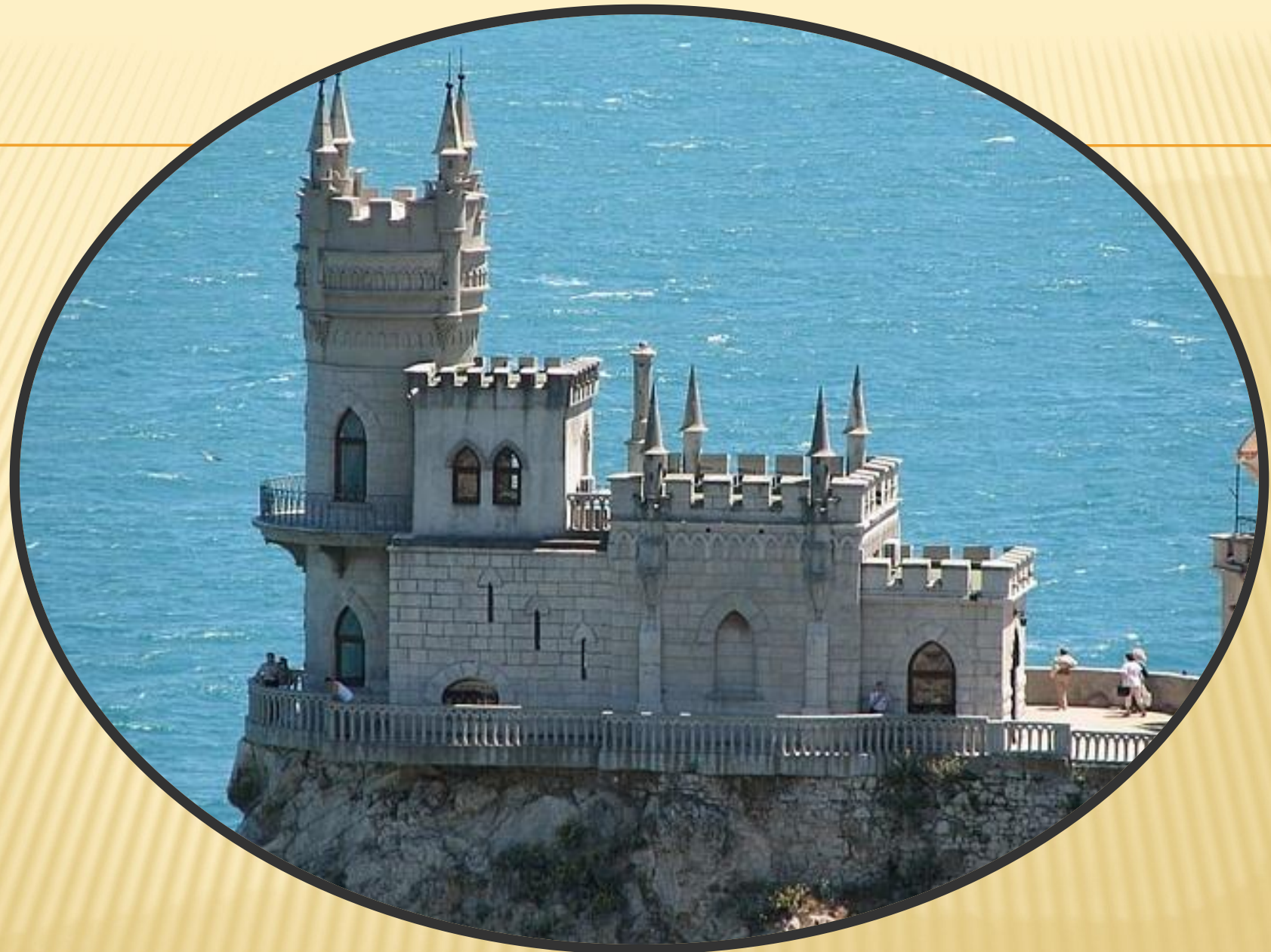
Ласточкино гнездо – г. Ялта