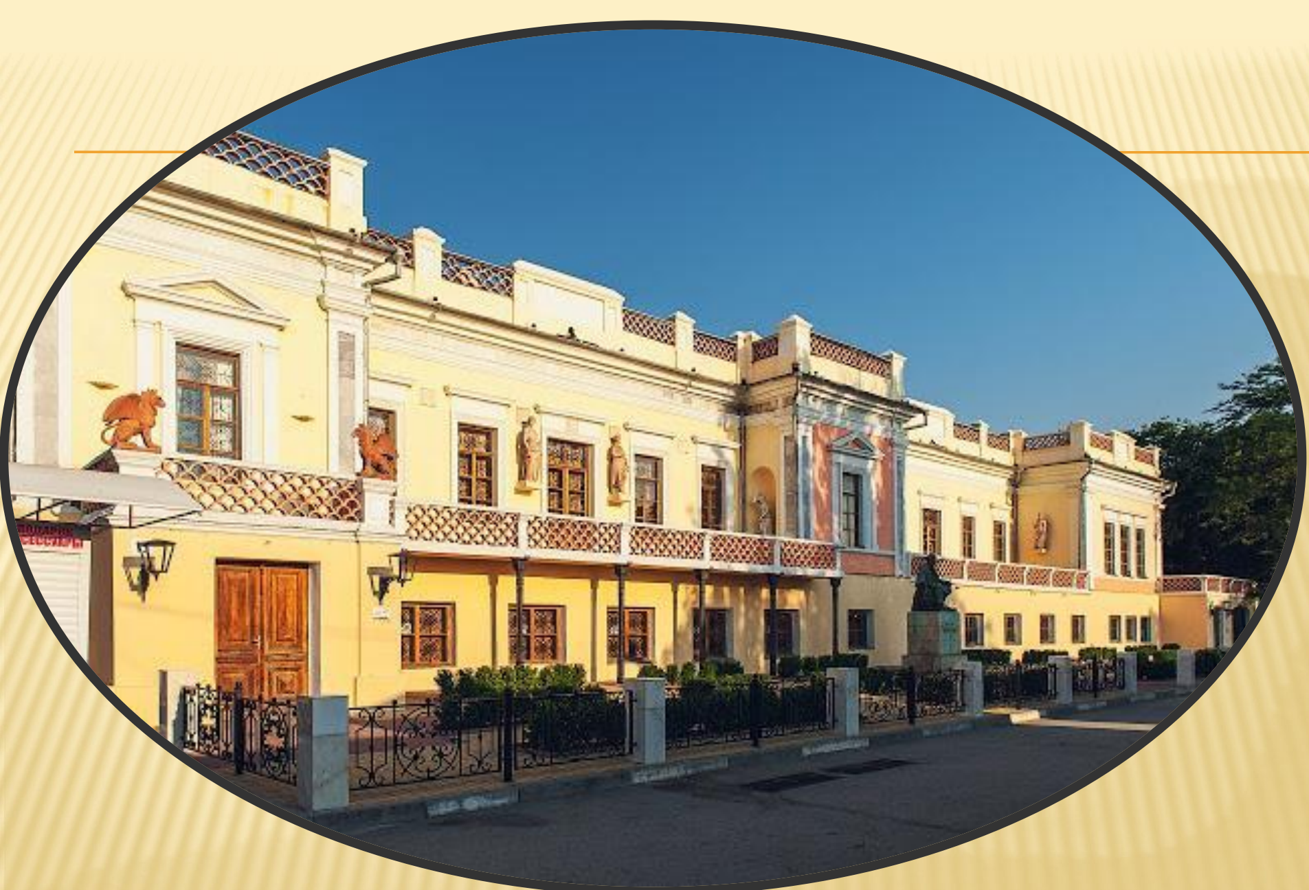
Дом-музей И.К. Айвазовского – г. Феодосия