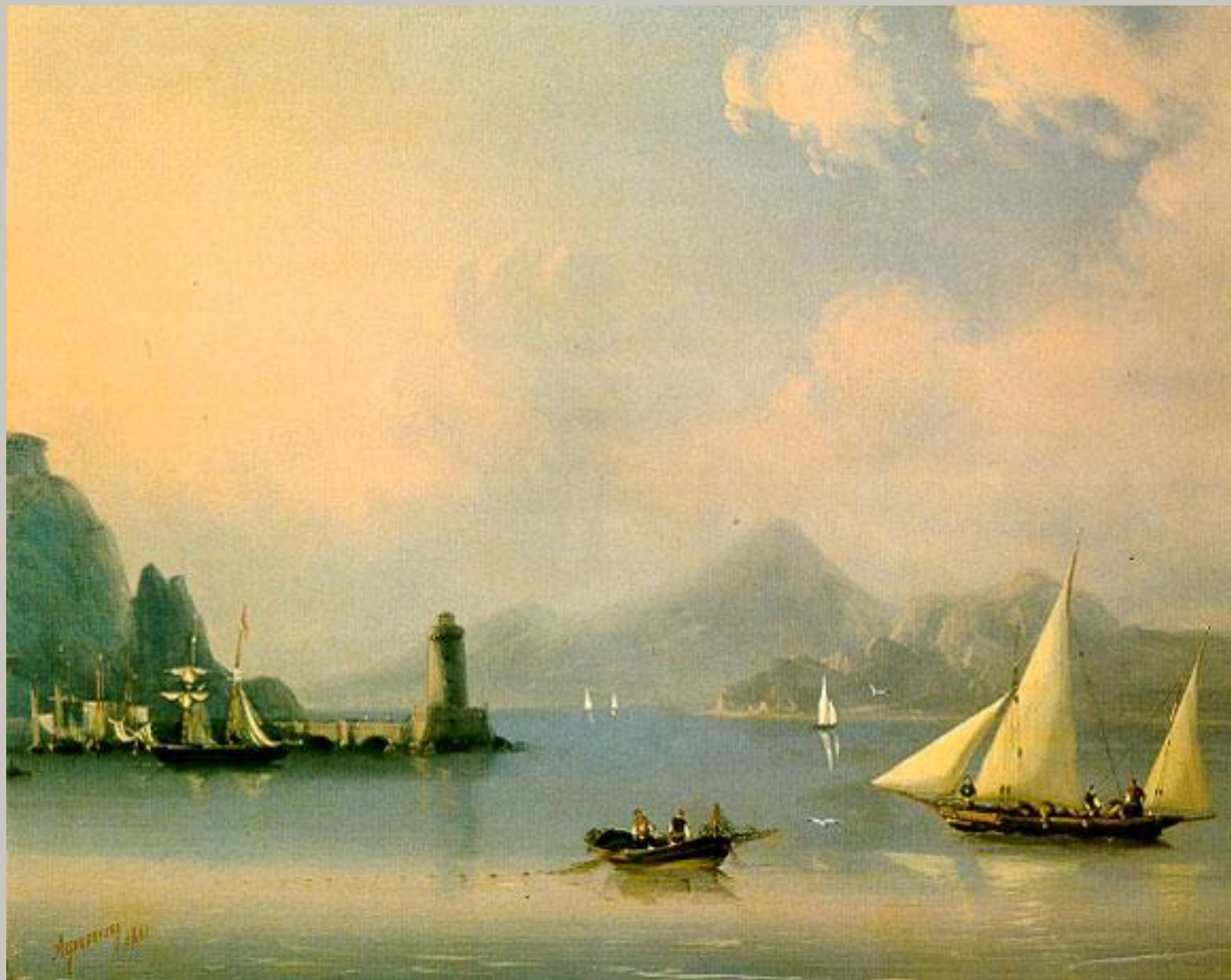
И.К. Айвазовский «Морской пролив с маяком»