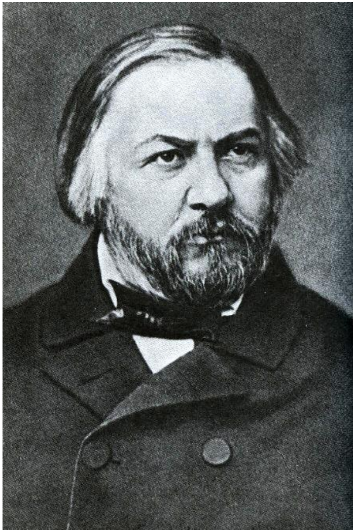
Михаил Иванович Глинка (1804-1857)

Композиторы «Могучей кучки» по праву считали себя наследниками М.И. Глинки и свою цель видели в развитии русской национальной музыки.