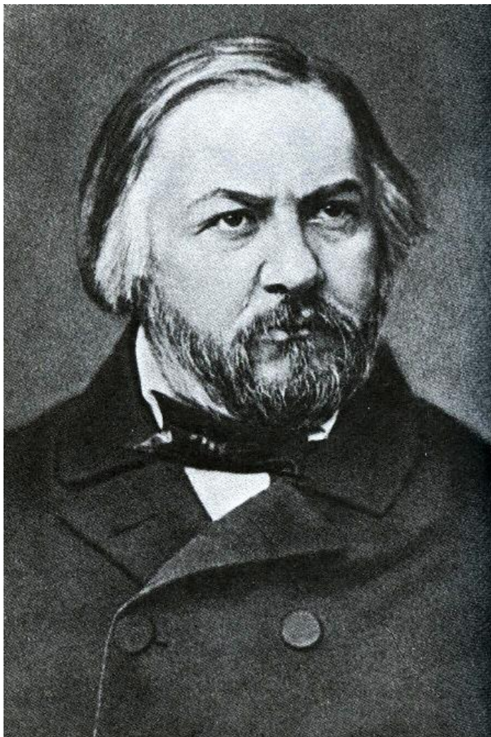
Михаил Иванович Глинка (1804-1857)

Композиторы «Могучей кучки» по праву считали себя наследниками М.И. Глинки и свою цель видели в развитии русской национальной музыки.