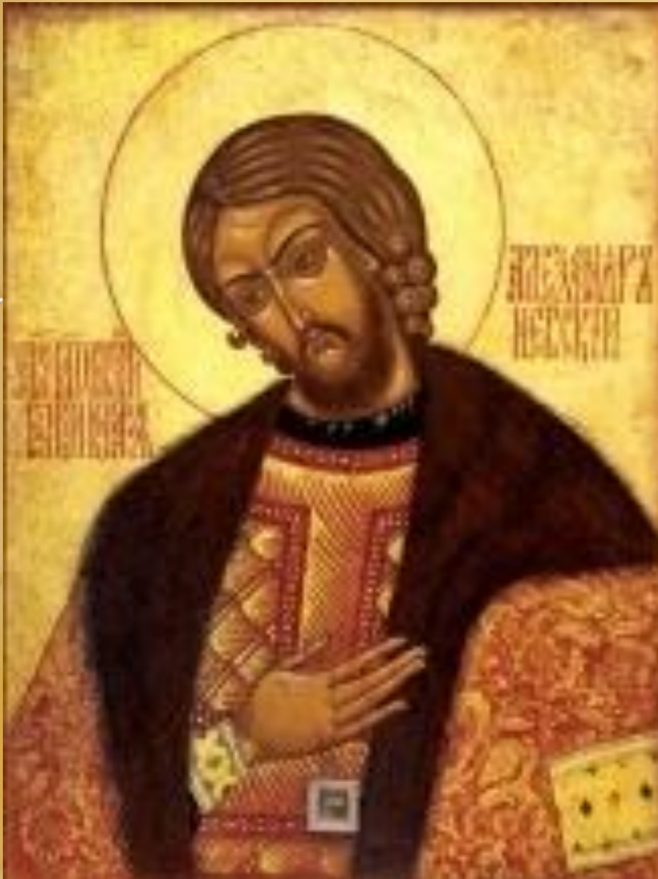
Икона Святой князь Александр Невский