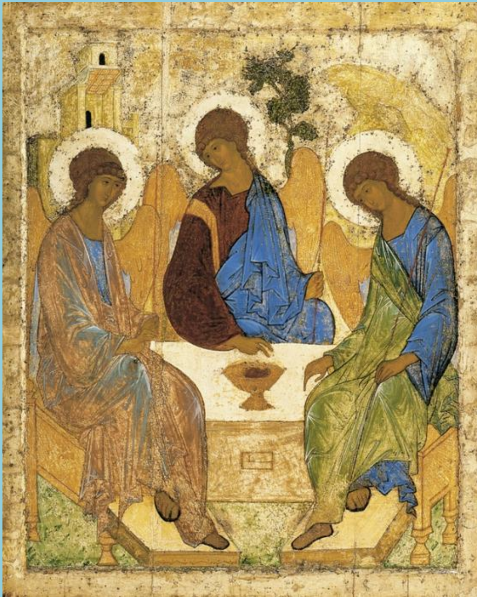
А. Рублев. Троица