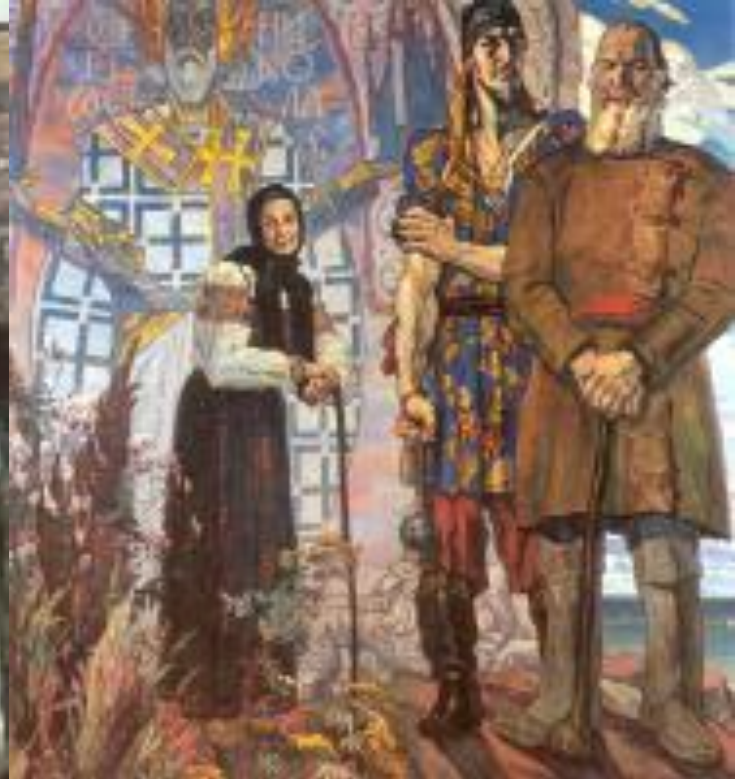
П. Корин. Триптих «А. Невский».