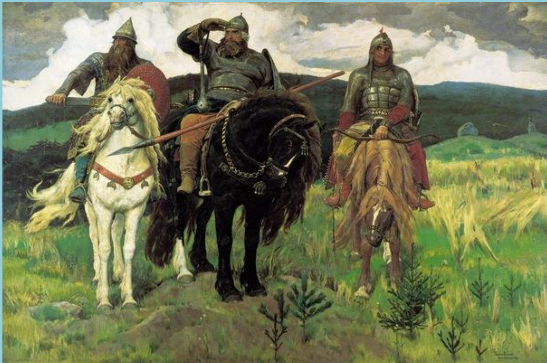
В. М. Васнецов. Богатыри.