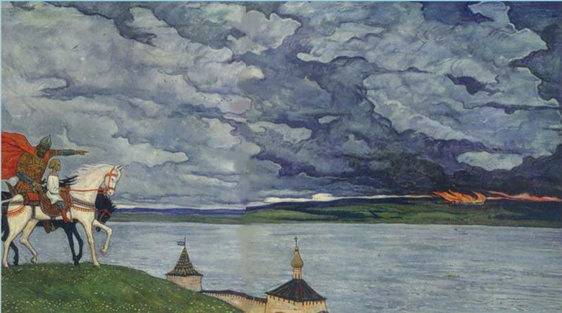
И. Глазунов. Два князя.