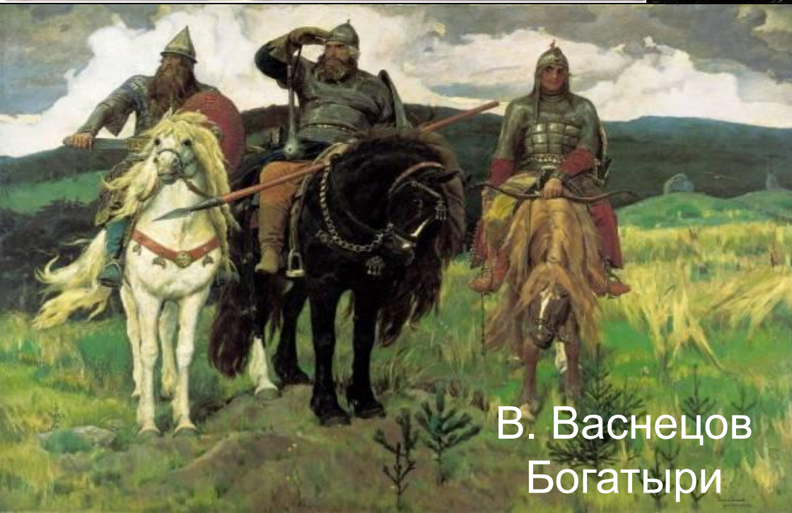
В. Васнецов Богатыри