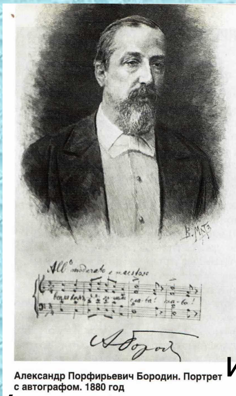
Александр Порфирьевич Бородин. Портрет с автографом. 1880 год

Александр Порфирьевич Бородин родился в Санкт-Петербурге 12 ноября 1833 года.