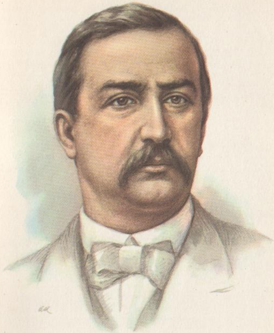
АЛЕКСАНДР ПОРФИРЬЕВИЧ БОРОДИН