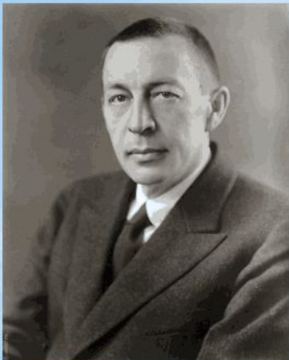
Сергей Васильевич Рахманинов