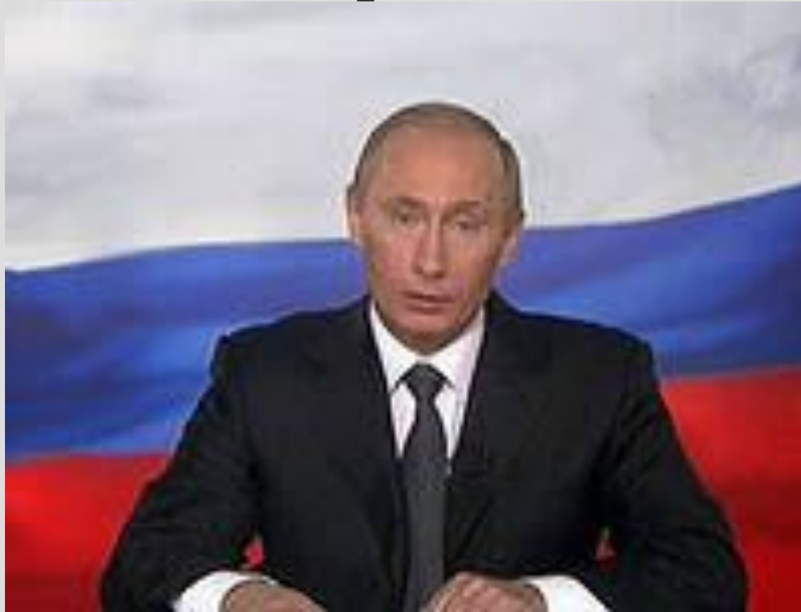
Владимир Владимирович Путин