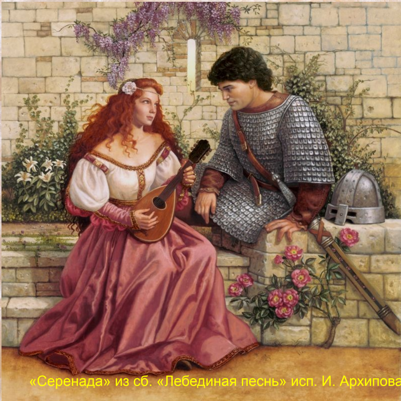
«Серенада» из сб. «Лебединая песнь» исп. И. Архипова