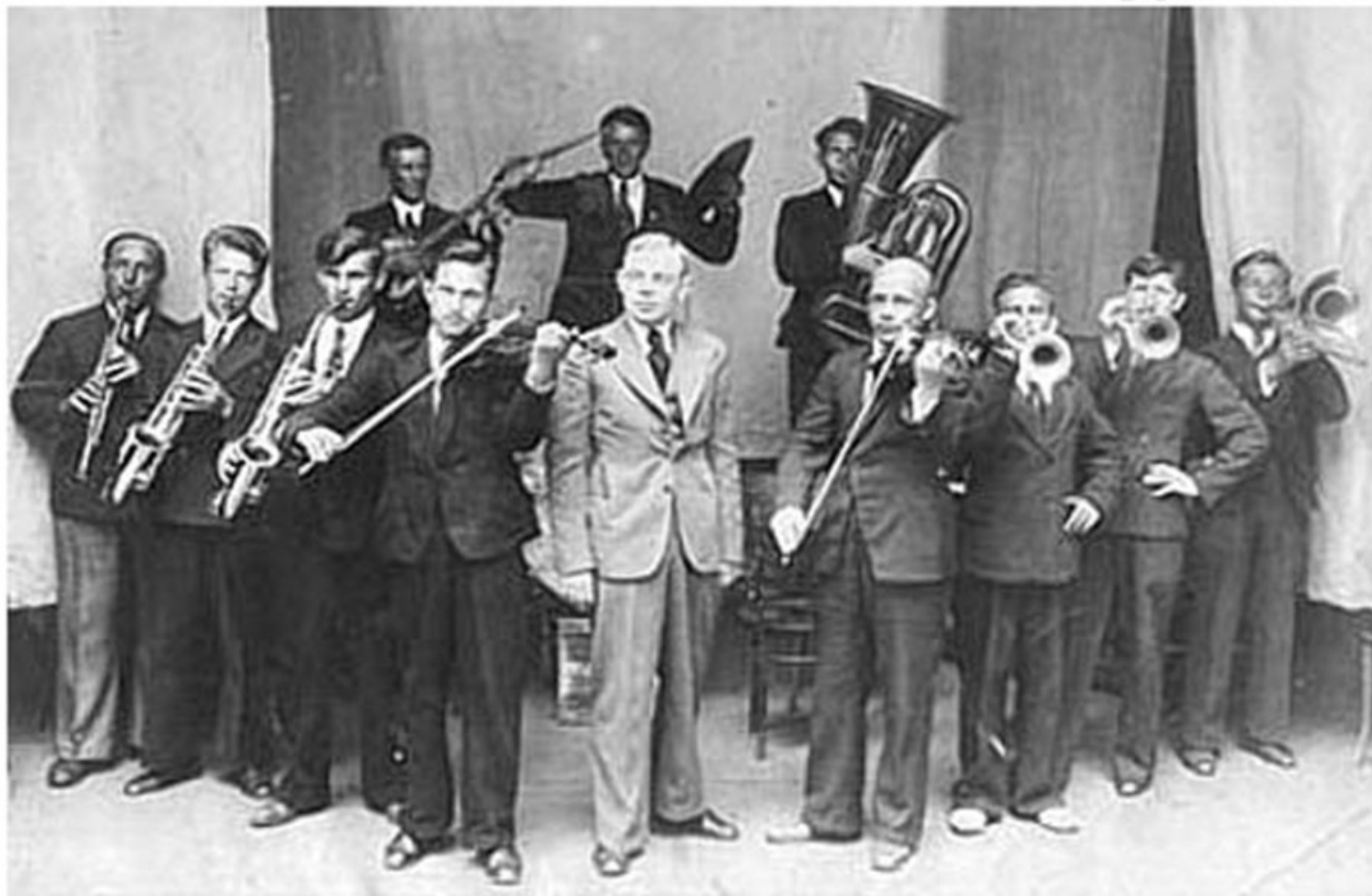
Первый в РСФСР эксцентрический оркестр "Джаз-банд" Валентина Парнаха