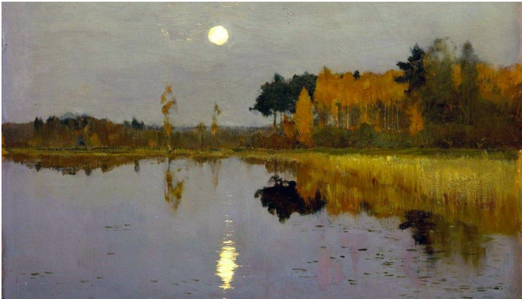
Художник. Исаак Левитан. «Сумерки. Луна».