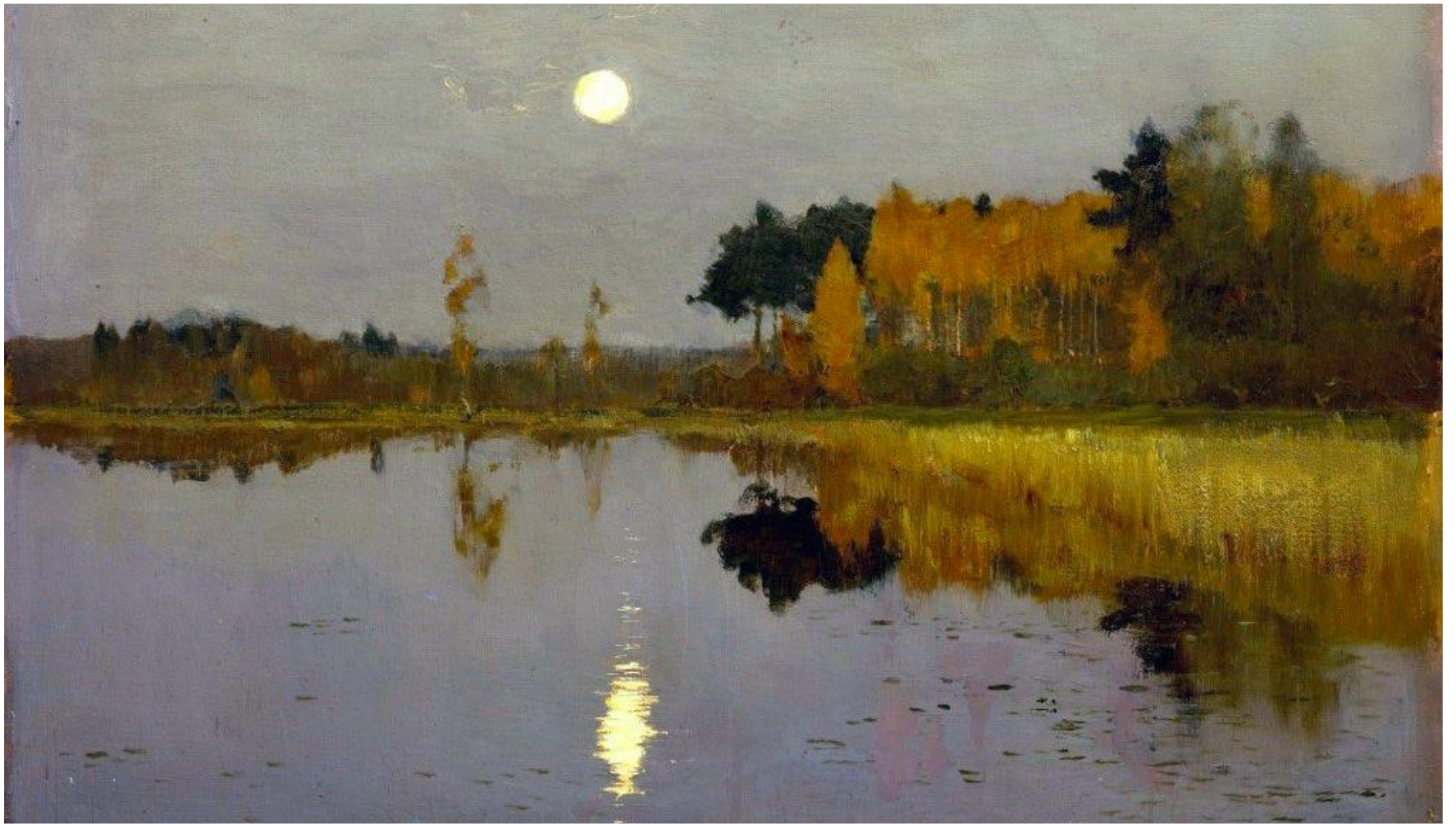
Художник. Исаак Левитан. «Сумерки. Луна».