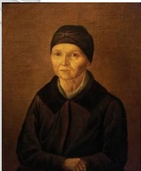
Арина Родионовна Яковлева (1758 – 1828)