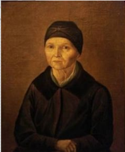
Арина Родионовна Яковлева (1758 – 1828)