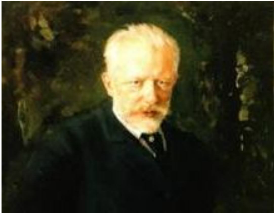
П.И. Чайковский «Зимнее утро»