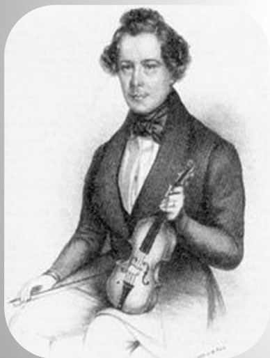
Йозев Франц Карл Ланнер – австрийский композитор