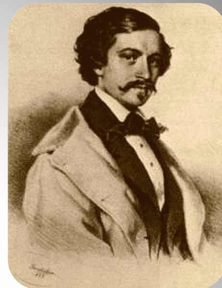
Иоганн Штраус (1825-1899) – «король вальсов»

Они были широко известны и популярны в XIX веке и способствовали популярности вальса, подарив миру более 500 произведений.