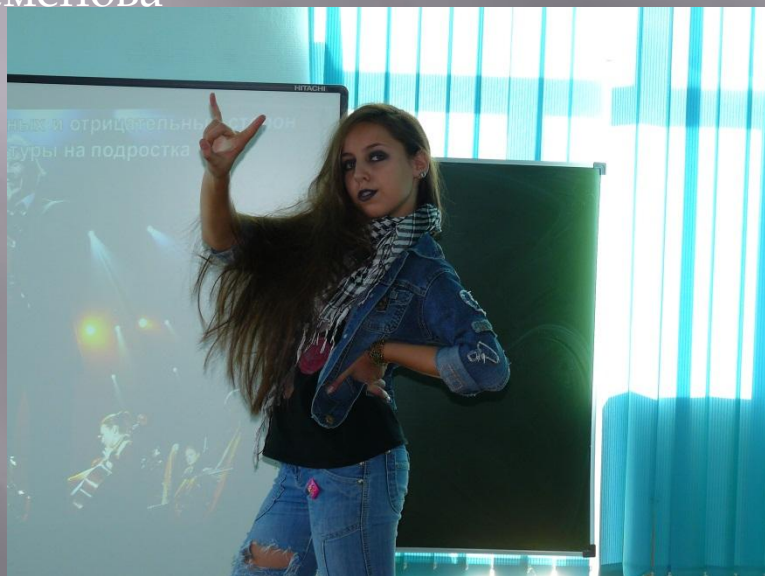
Подсудимая Рок- музыка