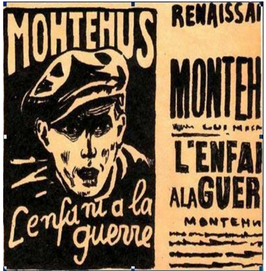
Афиша с портретом Монтегюса