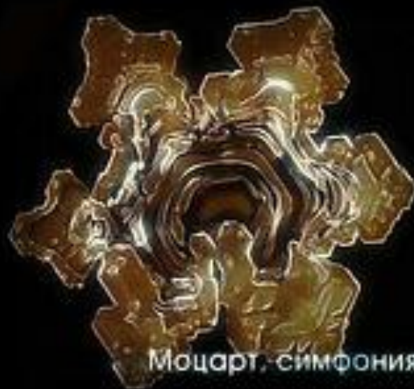
Моцарт, симфония №40