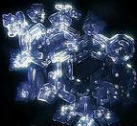
Бах, ария на струне соль