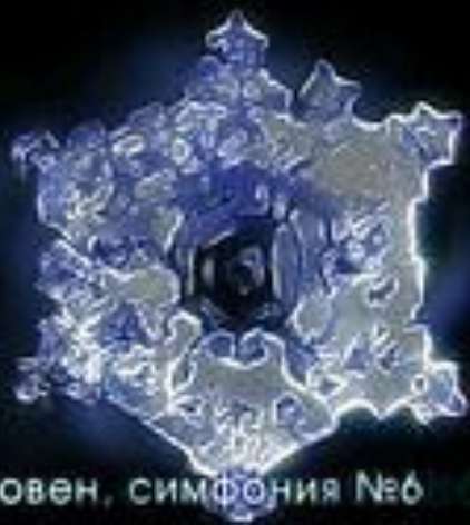
Бетховен, симфония №6