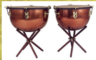
Группа ударных инструментов