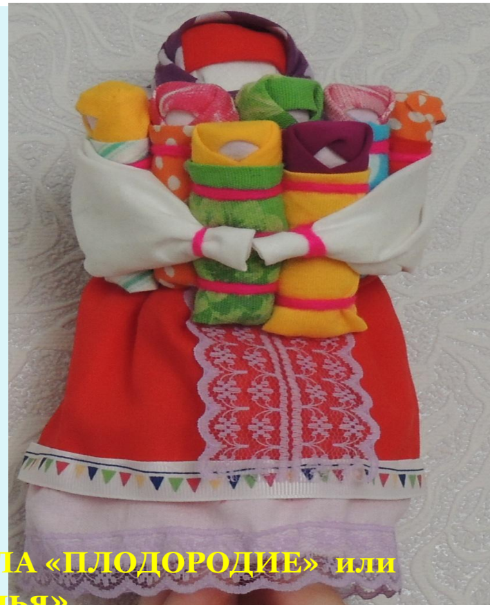
КУКЛА «ПЛОДОРОДИЕ» или «Семья»

- Злых людей не пускает, а Добрых встречает!