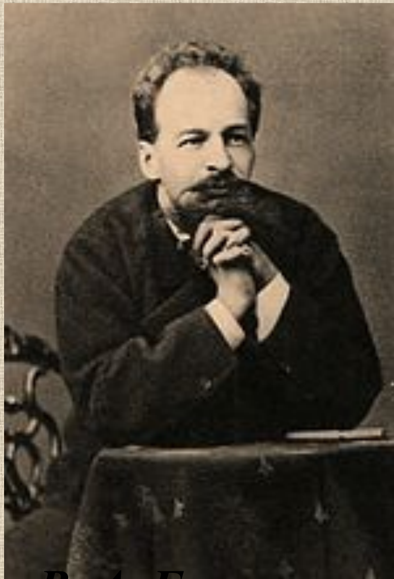
В. А. Гартман

Фортепианная сюита «Картинки с выставки»