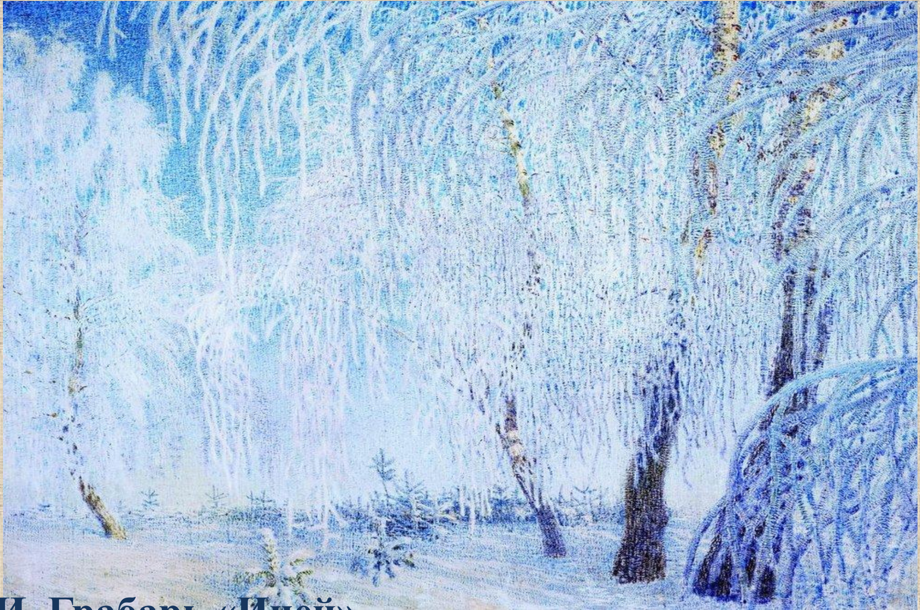
И. Грабарь «Иней»