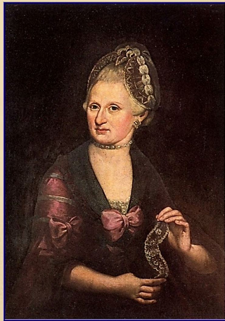
Анна Мария Моцарт