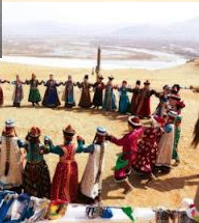
Ехор – древний бурятский национальный танец.