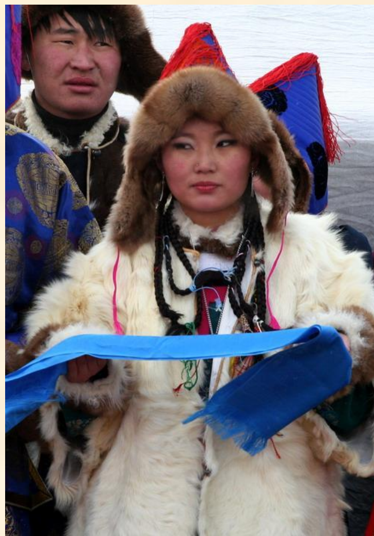
«Саган сара» белый месяц.