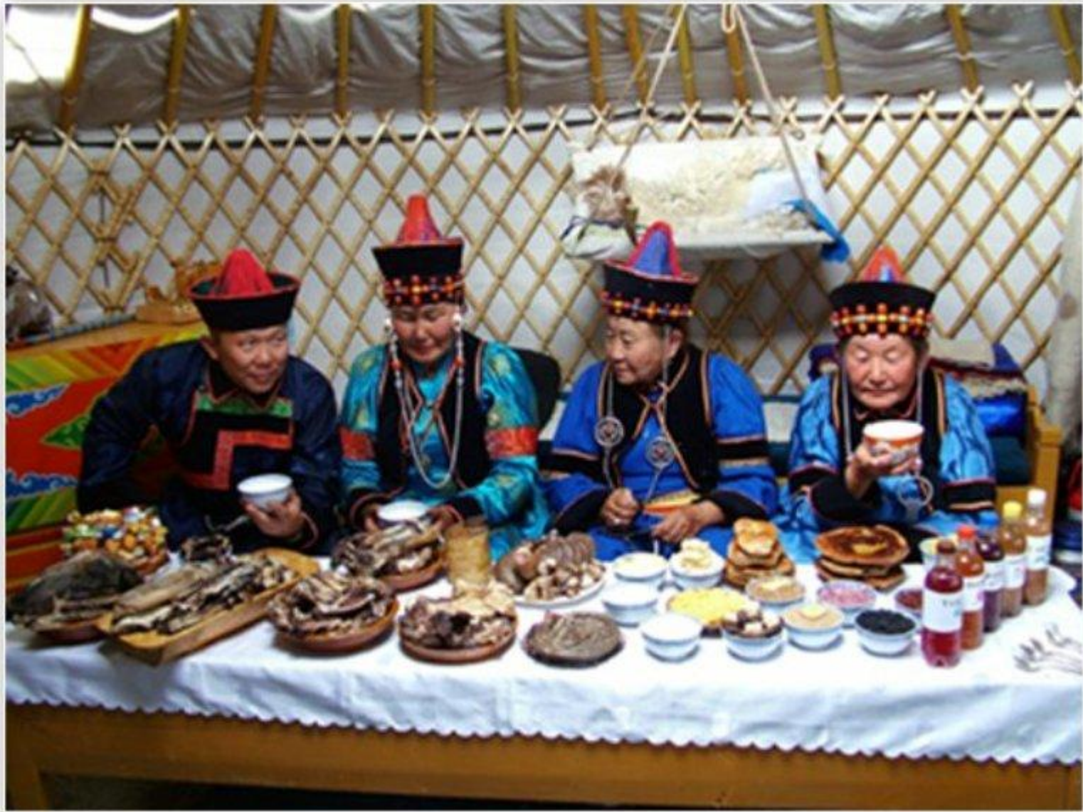
Бурятская национальная кухня.