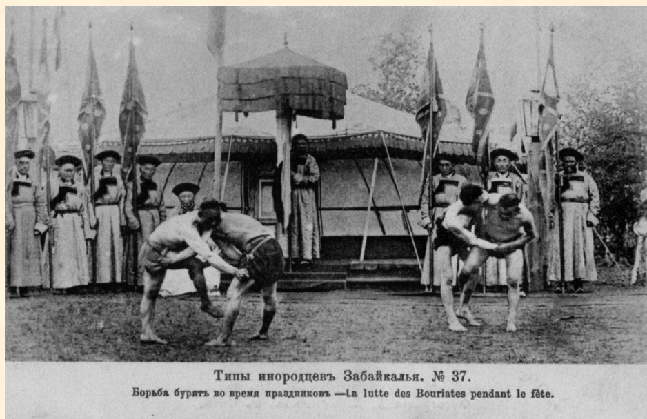
Типы инородцев Забайкалья. № 37.

История праздника очень древняя. Отмечать его было принято в феврале, на границе зимы и весны, в XVIII веке по приказу хана Хубилая, внука Чингис – хана.