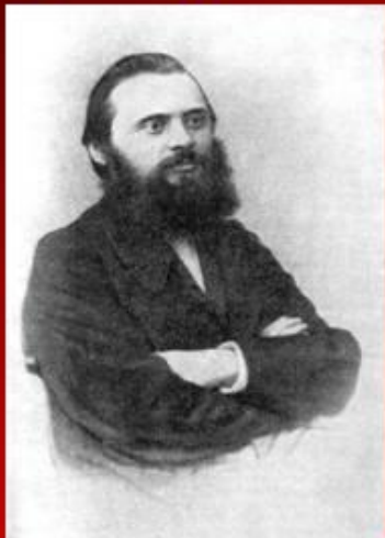
Милий Алексеевич Балакирев