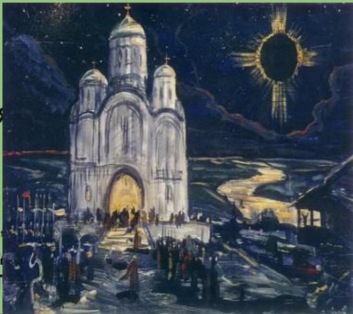
Илья Глазунов. ЗАТМЕНИЕ СОЛНЦА. Эскиз декорации к опере

ПРОЛОГ НА ПЛОЩАДИ ПУТИВЛЯ ДРУЖИНА, НАРОД ПРОСЛАВЛЯЮТ КНЯЗЯ ИГОРЯ, ЖЕЛАЕТ ПОБЕДЫ. ВНЕЗАПНО ТЕМНЕЕТ - НАЧИНАЕТСЯ СОЛНЕЧНОЕ ЗАТМЕНИЕ, ВСЕ ИСПУГАНЫ, СОВЕТУЮТ ОТЛОЖИТЬ ПОХОД, НО ИГОРЬ УВЕРЕН В ПРАВОТ СВОЕЙ - ЗАЩИТИТЬ НАРОД. СКУЛА И ЕРОШКА НЕЗАМЕТНО ДЕЗЕРТИРУЮТ.