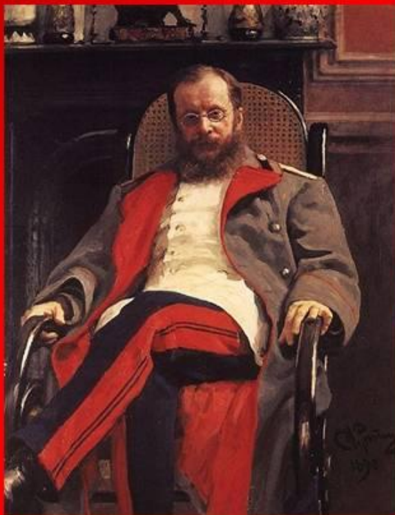
Цезарь Антонович Кюи