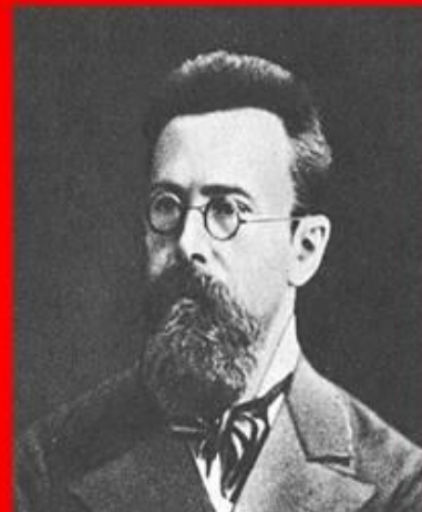
Н.А. Римский - Корсаков