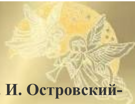
А. И. Островский- русский композитор