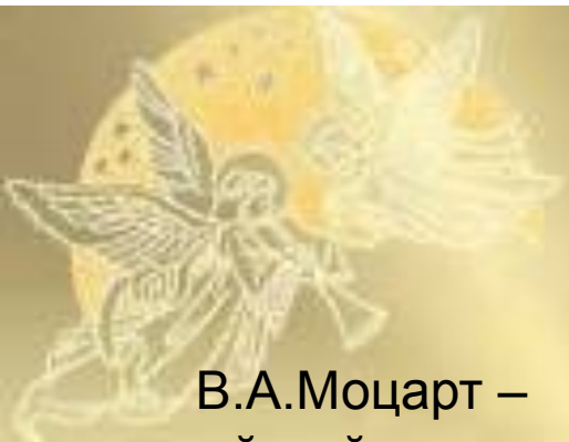
В.А.Моцарт – австрийский композитор