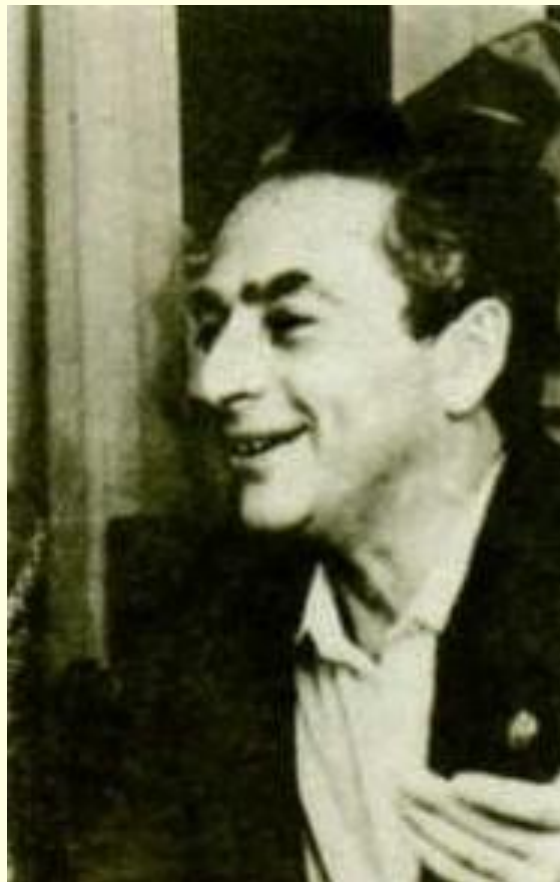
■ Александр Городницкий