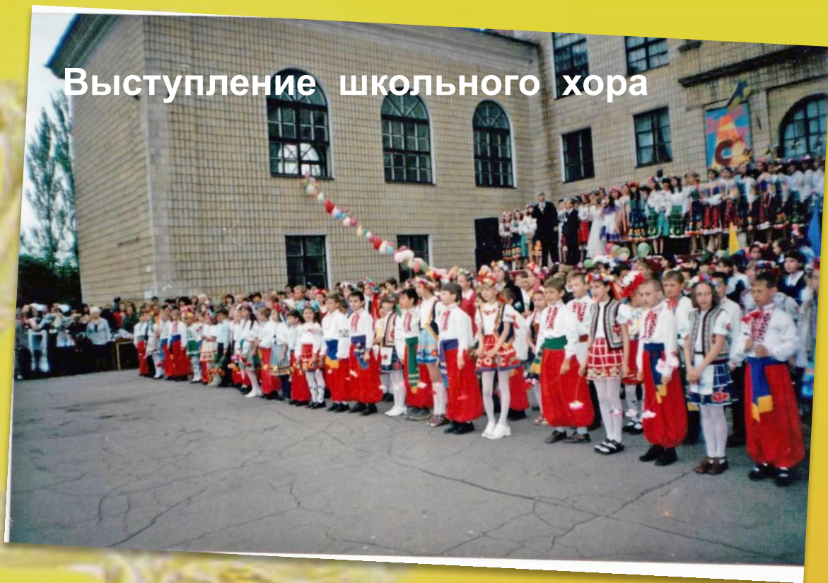
Выступление школьного хора

Студия эстрадного пения “Ли́ра” создана в 1988 году учителем музыки Гамаюновой С.С. и отметила в 2013 году 25-летний юбилей