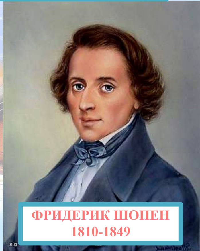
ФРИДЕРИК ШОПЕН 1810-1849

СОЗДАТЕЛЕМ ЖАНРА ИНСТРУМЕНТАЛЬНОЙ БАЛЛАДЫ ПРИЗНАН ПОЛЬСКИЙ КОМПОЗИТОР Ф. ШОПЕН.