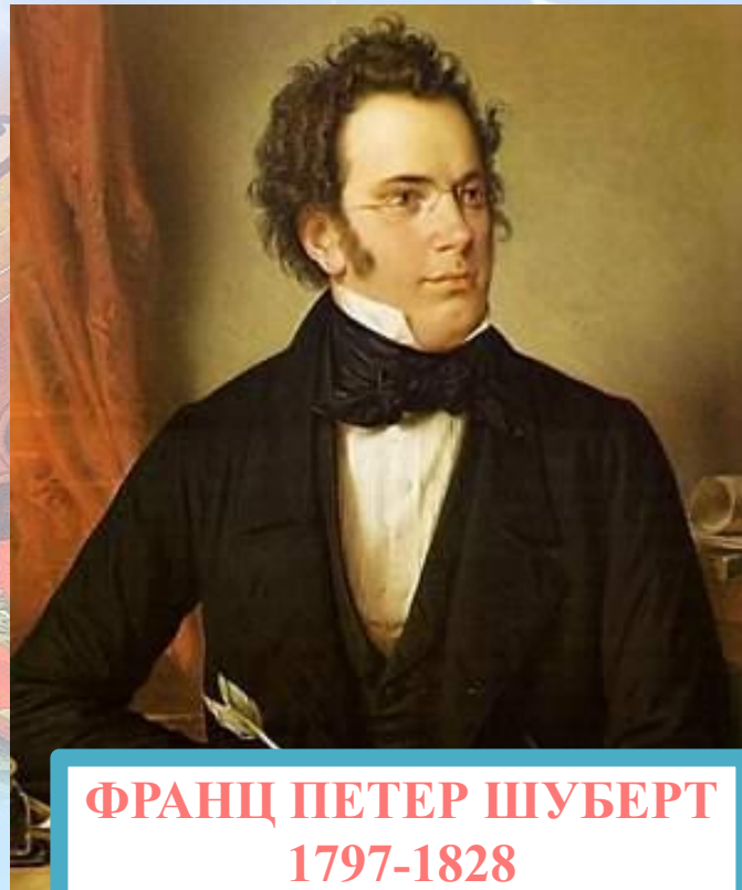
ФРАНЦ ПЕТЕР ШУБЕРТ 1797-1828

В МУЗЫКЕ БАЛЛАДА ВПЕРВЫЕ ПОЛУЧИЛА КЛАССИЧЕСКОЕ ВЫРАЖЕНИЕ В ВОКАЛЬНОМ ПРОИЗВЕДЕНИИ ФРАНЦА ШУБЕРТА.