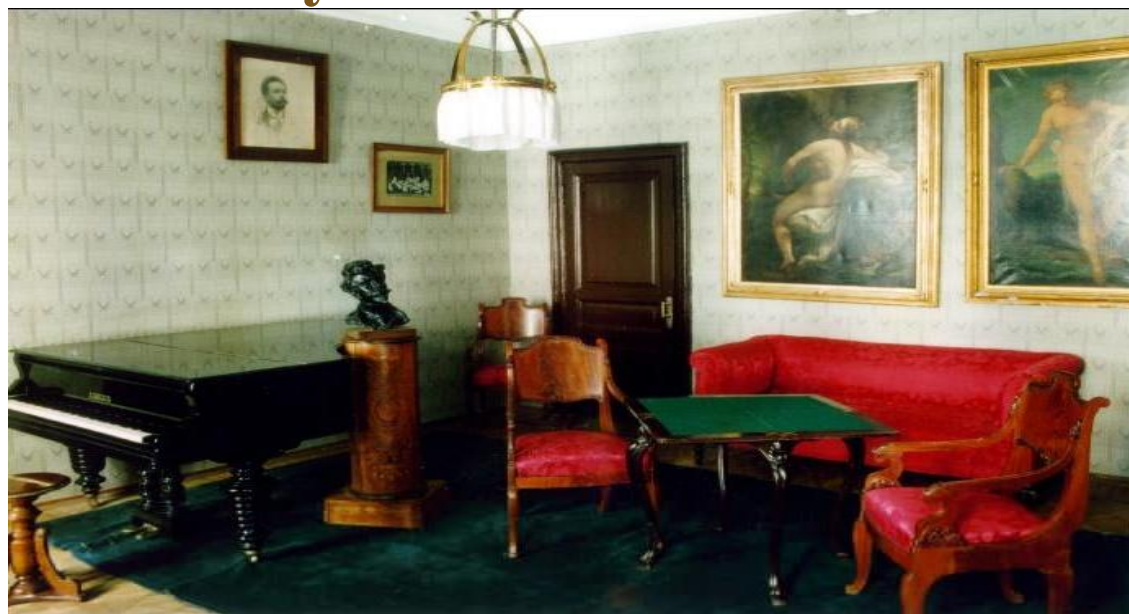
Гостиная в доме-музее А.Н.Скрябина

Творчество Скрябина оказало существенное воздействие на фортепианную и симфоническую музыку 20 в. Получили дальнейшее развитие идеи синтеза музыки и света. В 1922 в помещении последней квартиры Скрябина в Москве организован музей.