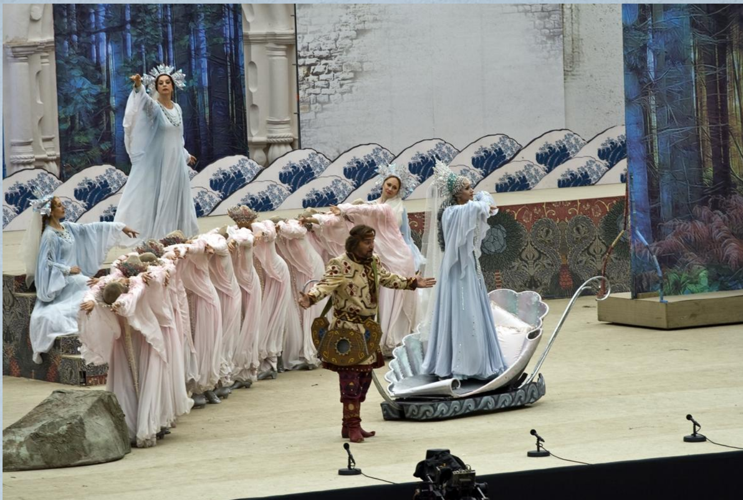
Н.А. Римский-Корсаков опера-былина «Садко»