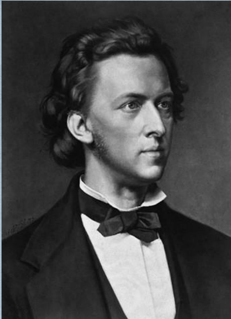
Фредерик Шопен (1810-1849)