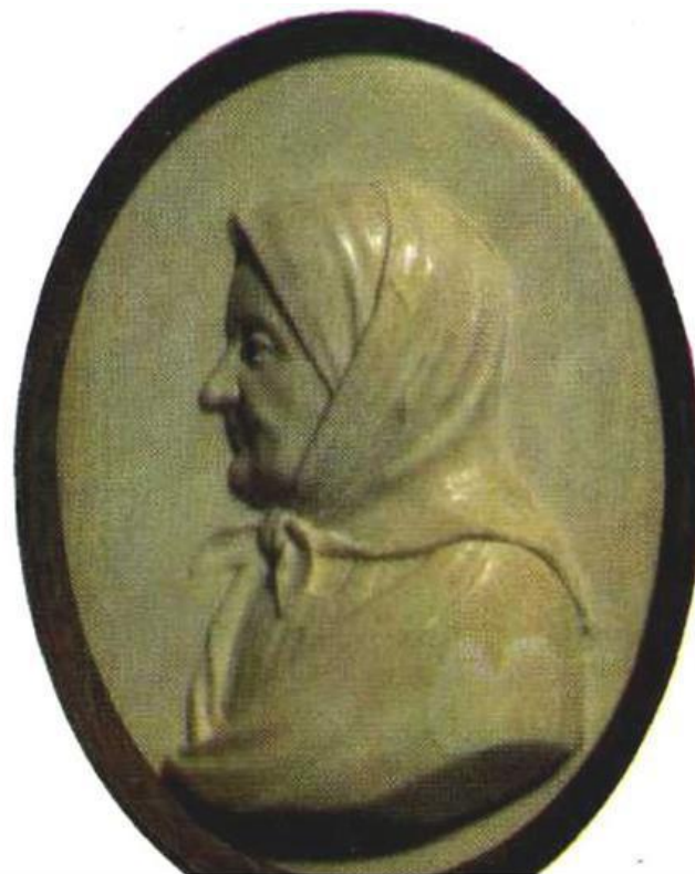
Няня Арина Родионовна