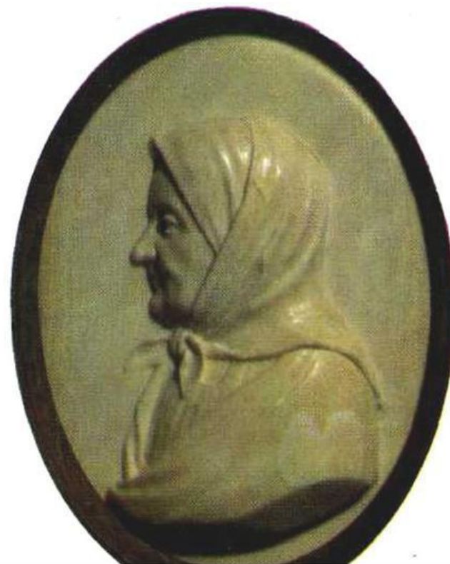
Няня Арина Родионовна