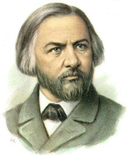
Михаил Иванович Глинка (1804-1857) Эпоха классицизма