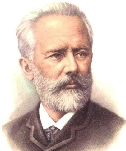
Петр Ильич Чайковский (1840-1893) Эпоха романтизма