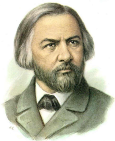
Михаил Иванович Глинка (1804-1857) Эпоха классицизма