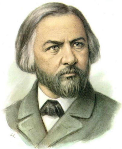
Михаил Иванович Глинка (1804-1857) Эпоха классицизма