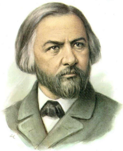
Михаил Иванович Глинка (1804-1857) Эпоха классицизма