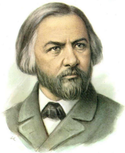
Михаил Иванович Глинка (1804-1857) Эпоха классицизма