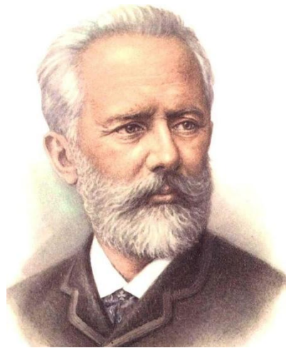
Петр Ильич Чайковский (1840-1893) Эпоха романтизма