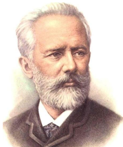
Петр Ильич Чайковский (1840-1893) Эпоха романтизма