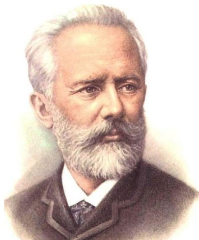
Петр Ильич Чайковский (1840-1893) Эпоха романтизма