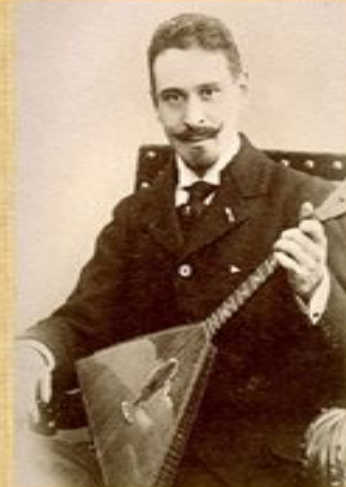
«Воскресла» домра только в конце XIX века благодаря талантливому исследователю, музыканту и подвижнику В.В. Андрееву.