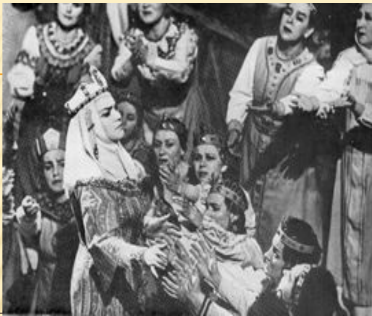
СЦЕНА ИЗ ОПЕРЫ "КНЯЗЬ ИГОРЬ" ГОСУДАРСТВЕННЫЙ БОЛЬШОЙ АКАДЕМИЧЕСКИЙ ТЕАТР.