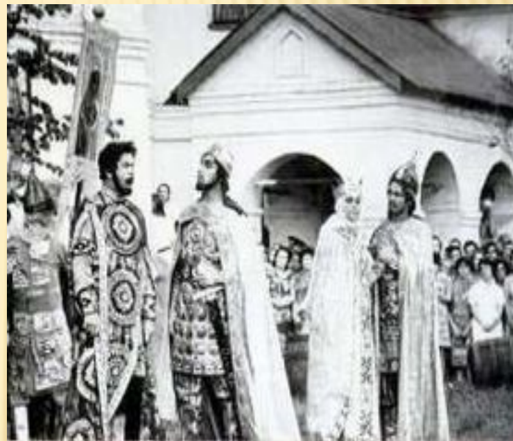
Сцена из оперы "Князь Игорь". Самарский театр в декорациях Ярославского кремля.