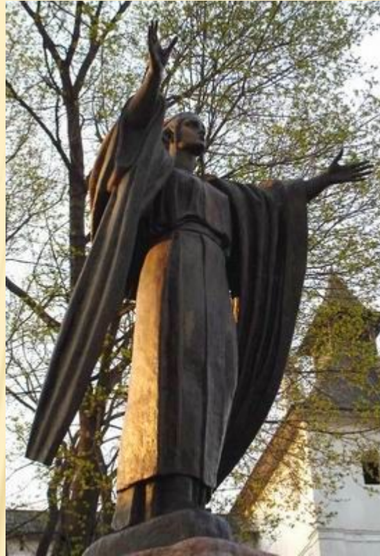
Город Путивль. Памятник Ярославне