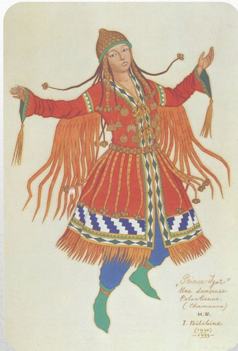
Иван Билибин. Половчанка. Эскиз костюма к опере А. П. Бородина «Князь Игорь». 1930