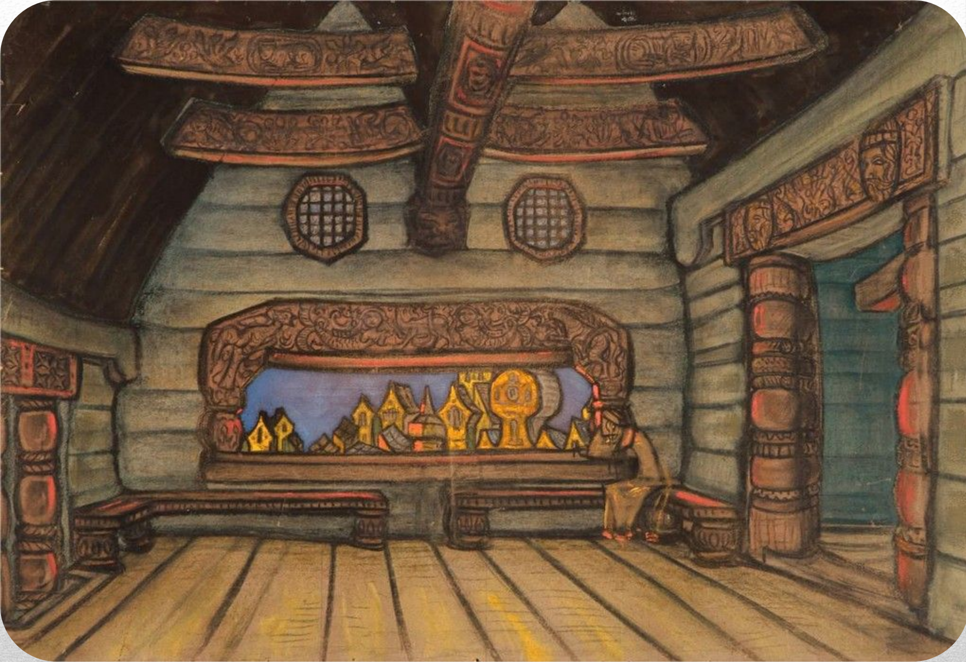
Николай Рерих. Терем Ярославны. Эскиз декорации к опере А. П. Бородина «Князь Игорь». 1914