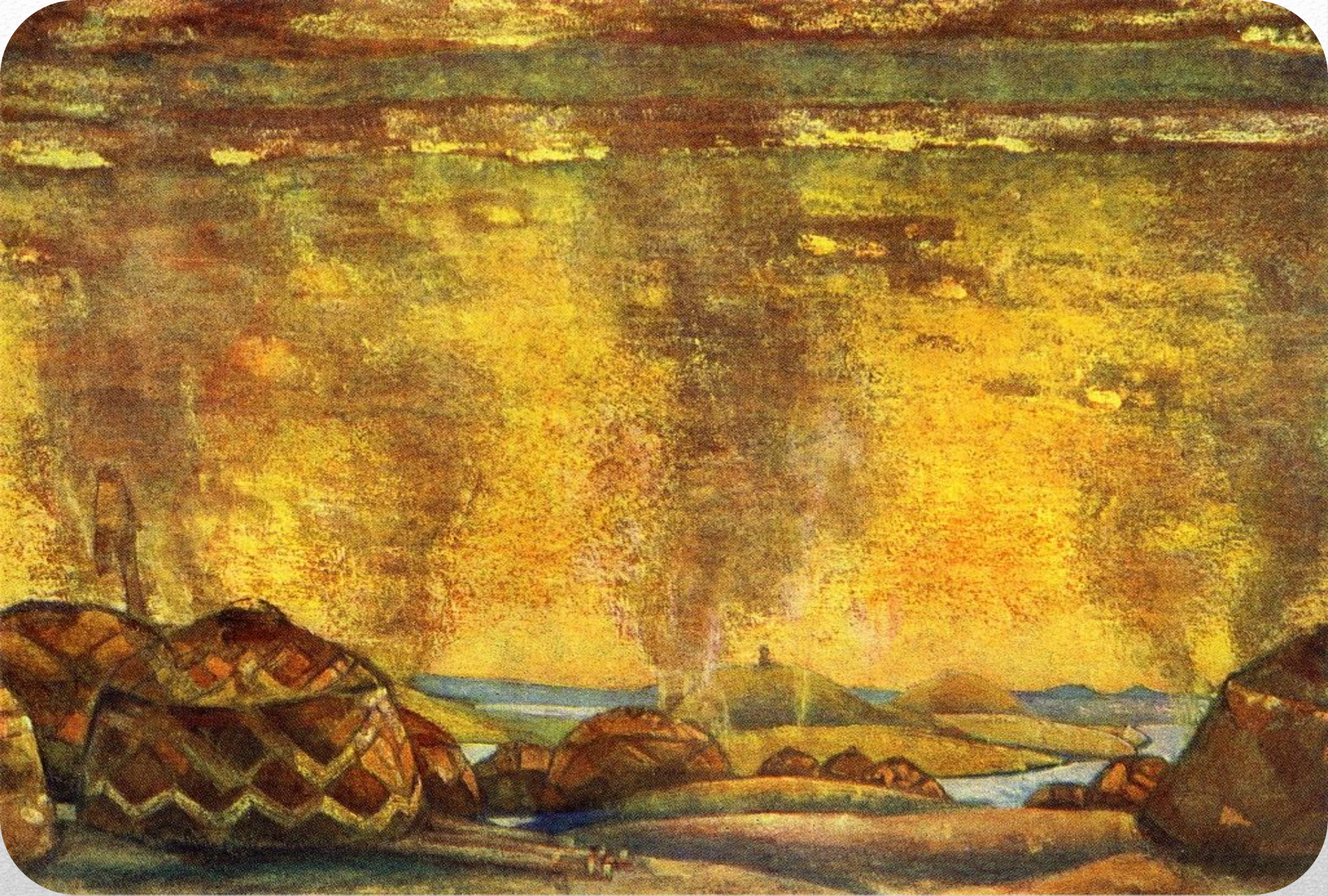
Рерих Н.К. Половецкий стан. Опера «Князь Игорь». 1909