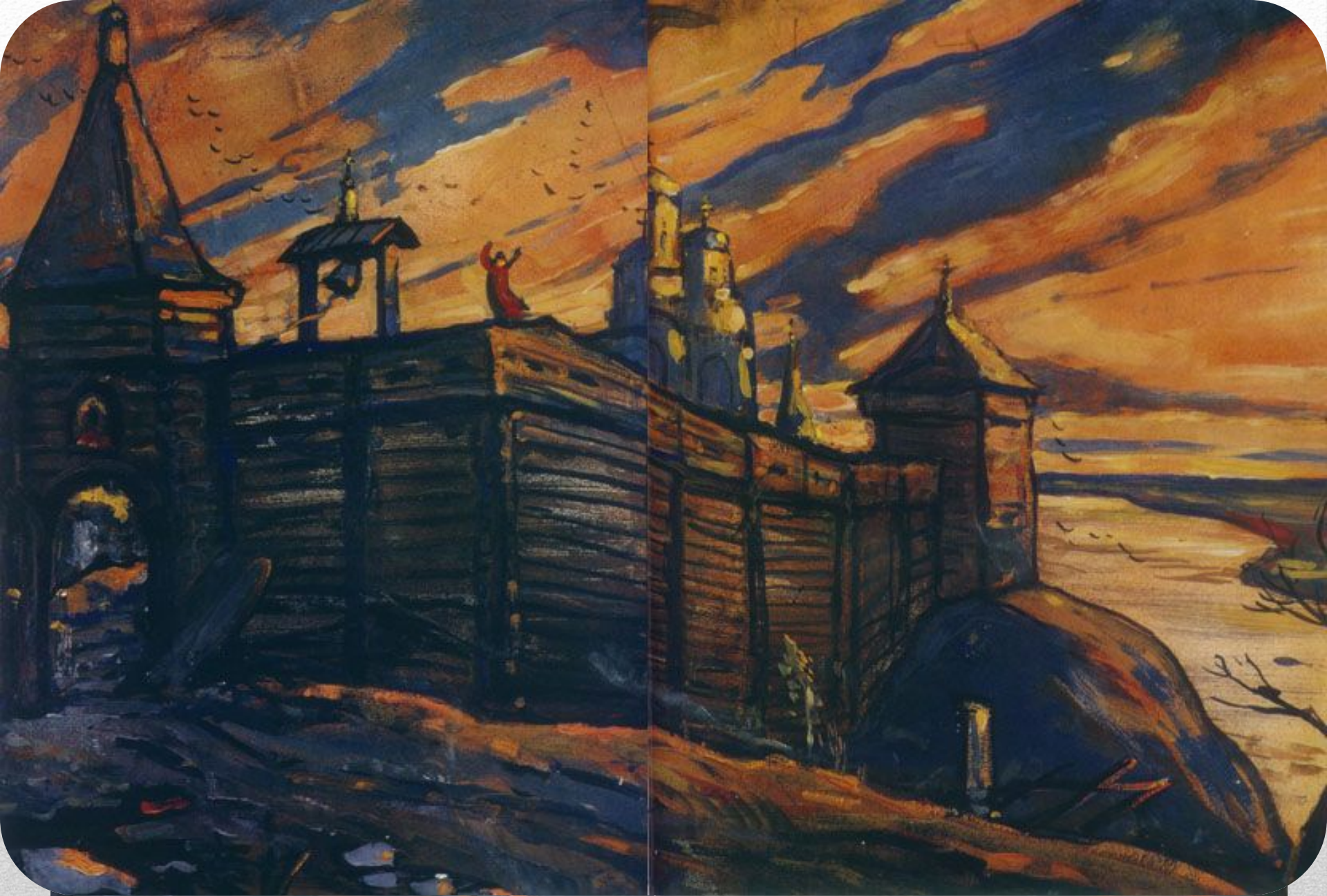
Илья Глазунов. СТЕНЫ ПУТИВЛЯ.1980 г. Эскиз декорации к опере А. П. Бородина "Князь Игорь"