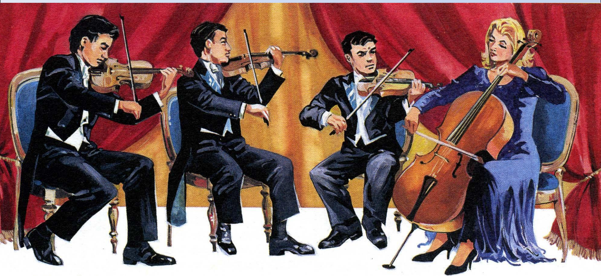
струнный квартет во время концерта.