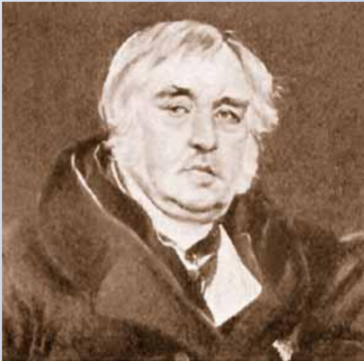
Иван Андреевич Крылов