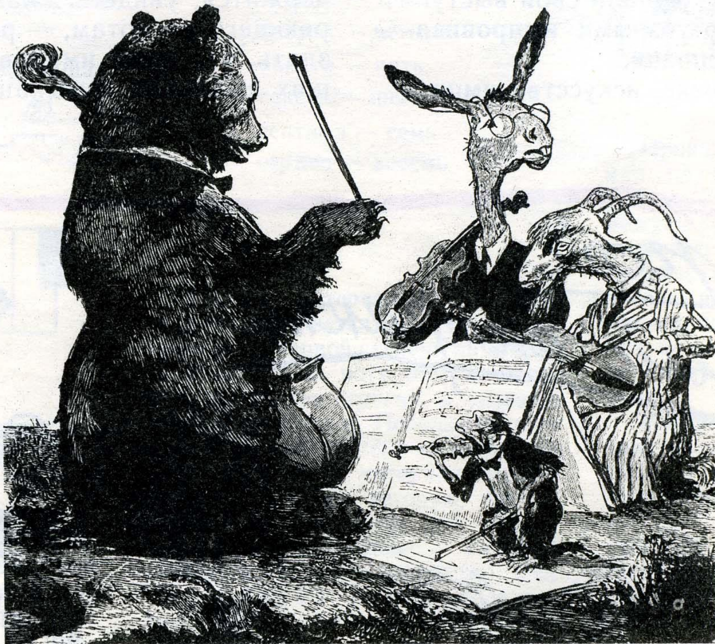
Кукрыниксы. Иллюстрация к басне И. Крылова «Квартет»