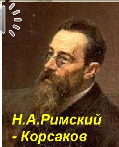
Н.А.Римский - Корсаков