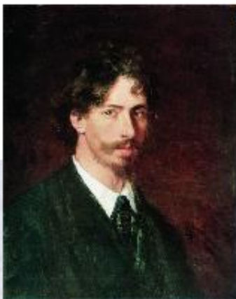
И.Е.Репин (1844 — 1930)