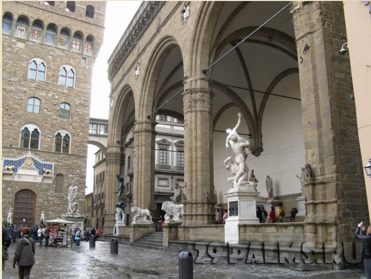
Флорентийская камерата. Флоренция. XVI век

С 1573 года во Флоренции было создано содружество музыкантов (также теоретиков музыки) и литераторов, с целью совместного обсуждения древнегреческой музыки и способа её воплощения в современной итальянской музыке, которому дали название Флорентийская камерата (итал. camerata — компания, кружок).