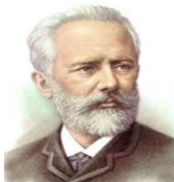
П.И.Чайковский называл оркестр

«Музыка прежде всего искусство человеческого общения»