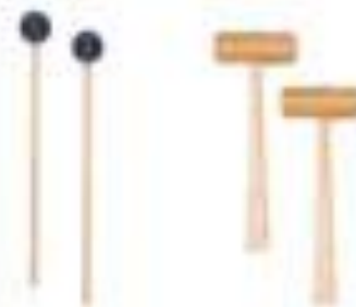
ПАЛОЧКИ И МОЛОТОЧКИ ДЛЯ УДАРНЫХ ИНСТРУМЕНТОВ