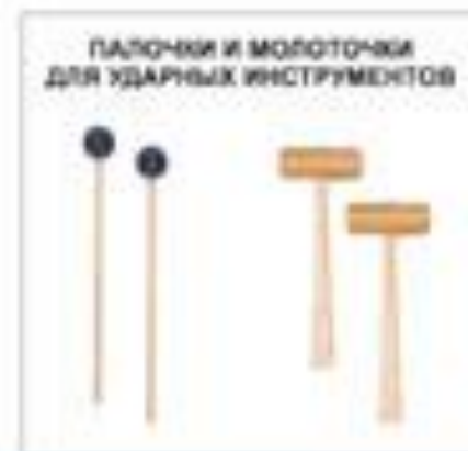
ПАЛОЧКИ И МОЛОТОЧКИ ДЛЯ УДАРНЫХ ИНСТРУМЕНТОВ