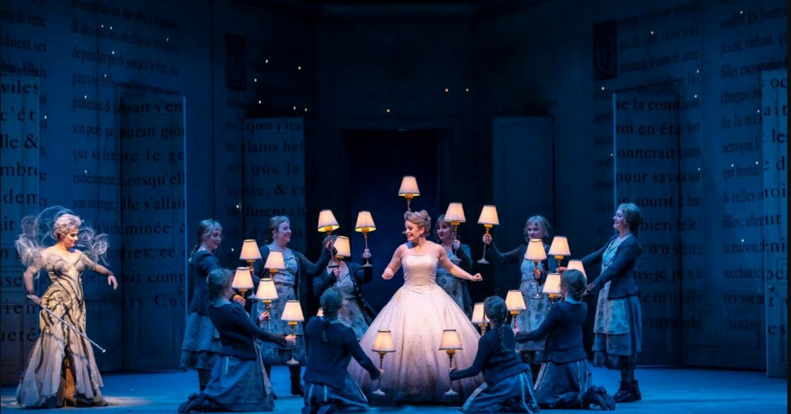
действия - на картины