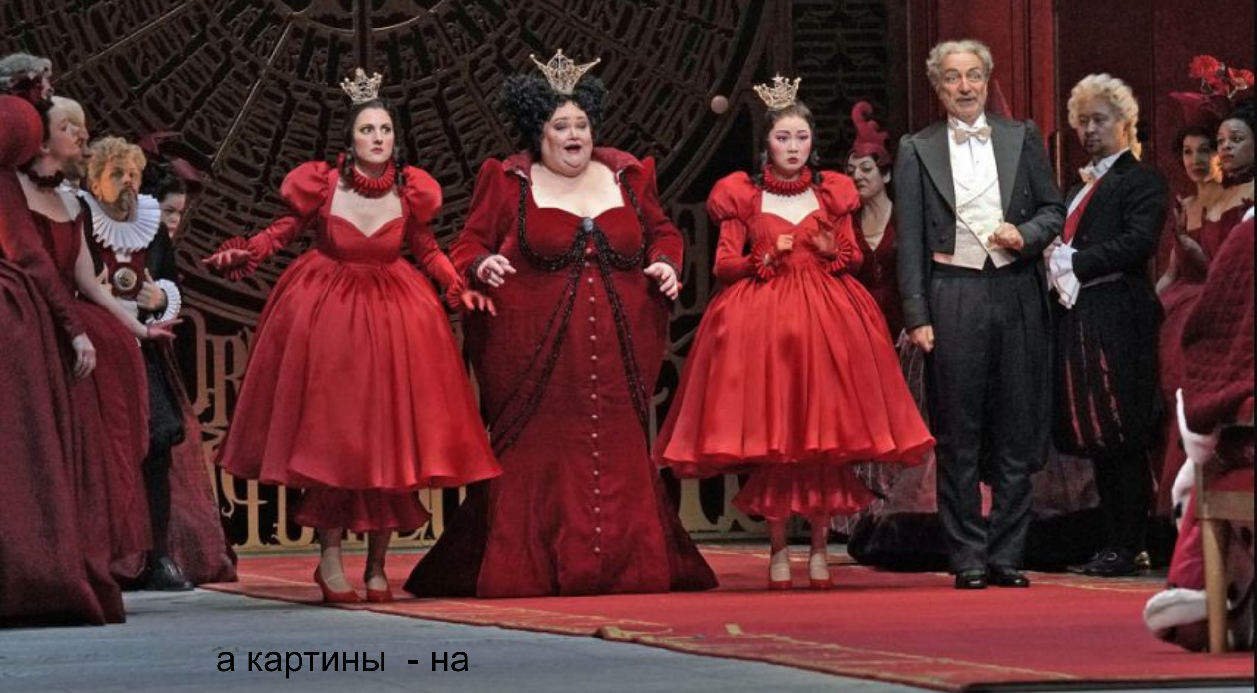
а картины - на сцены