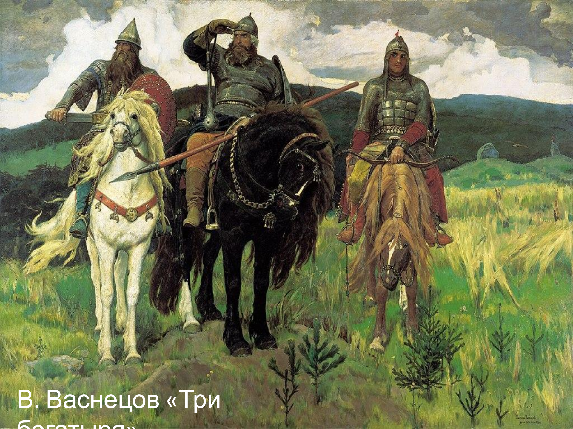
В. Васнецов «Три богатыря»